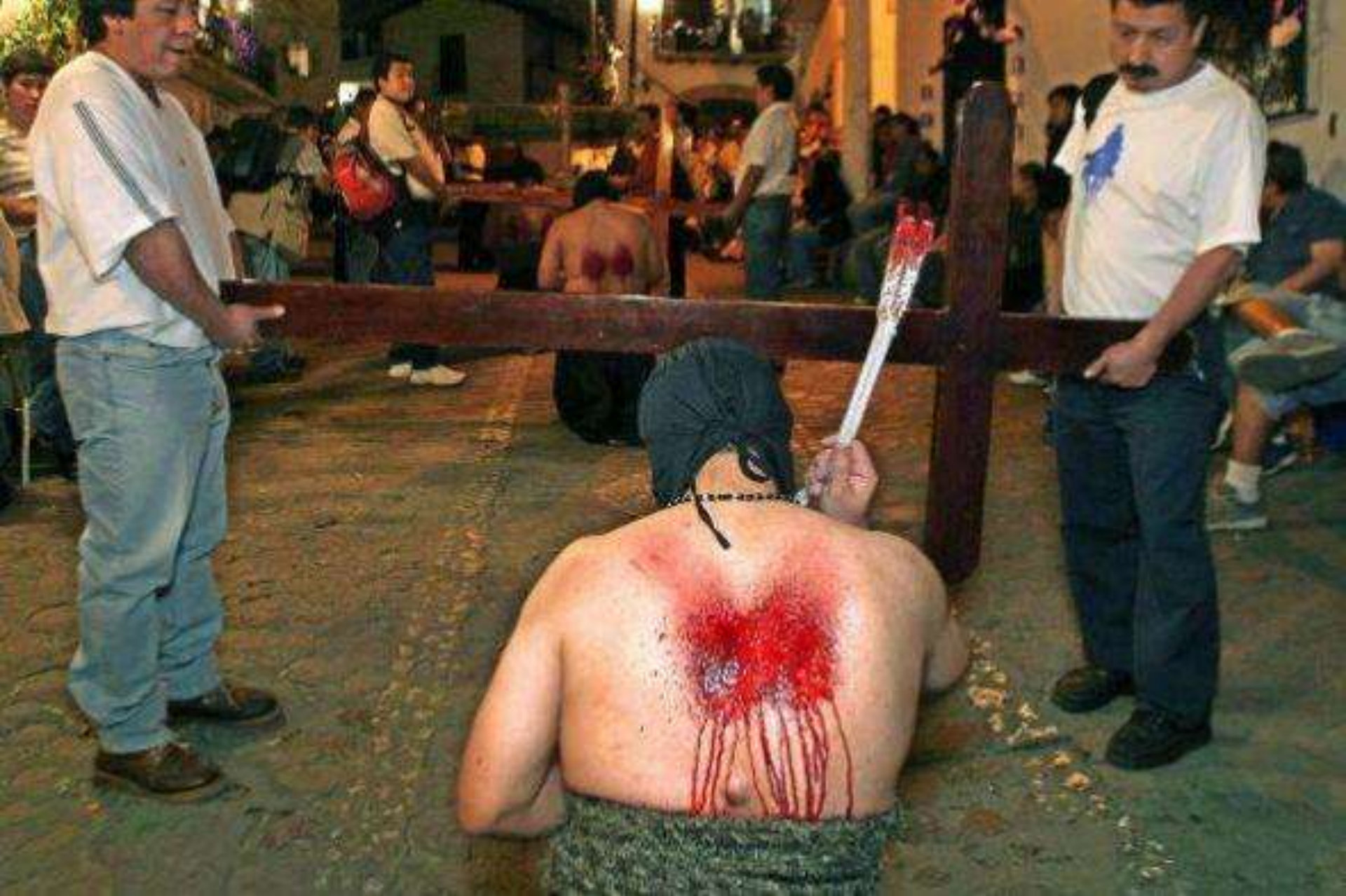
Con el torso desnudo, se autoflagelan durante la procesión por las calles coloniales de Taxco, Guerrero