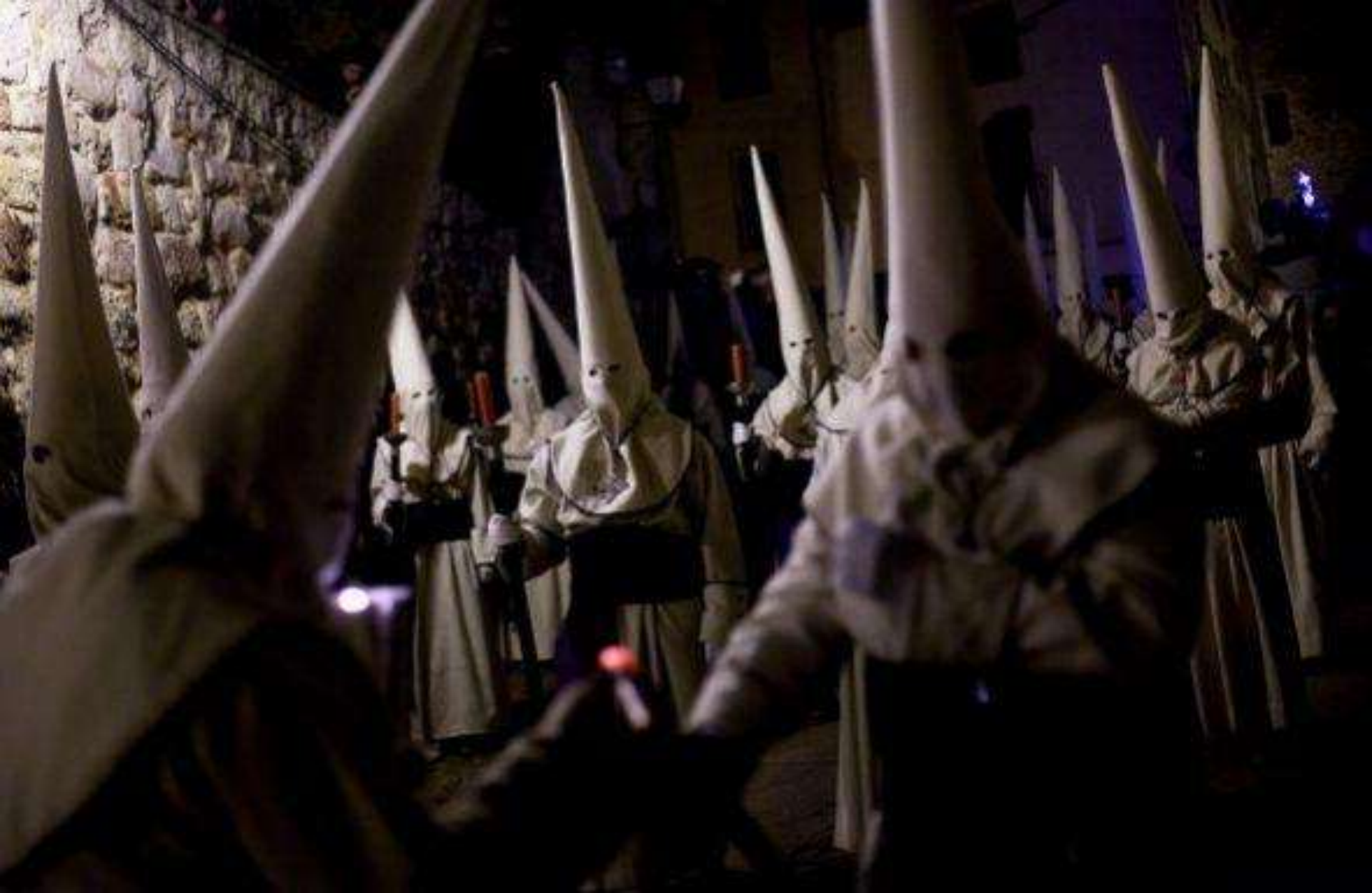
Las calles de Zamora se llenan de penitentes