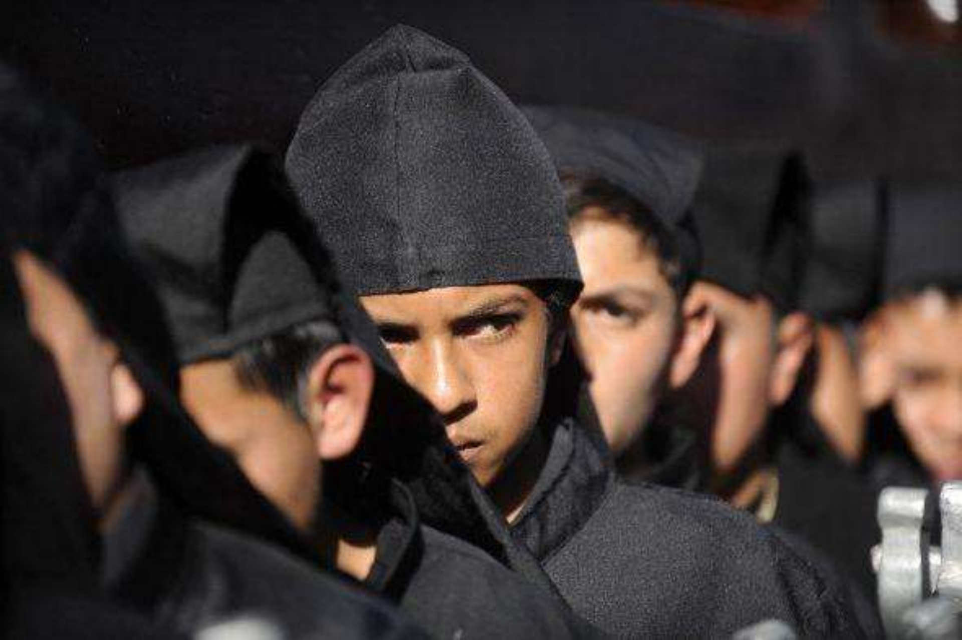
En Guatemala las túnicas negras abundan durante los festejos del “Santo Entierro”