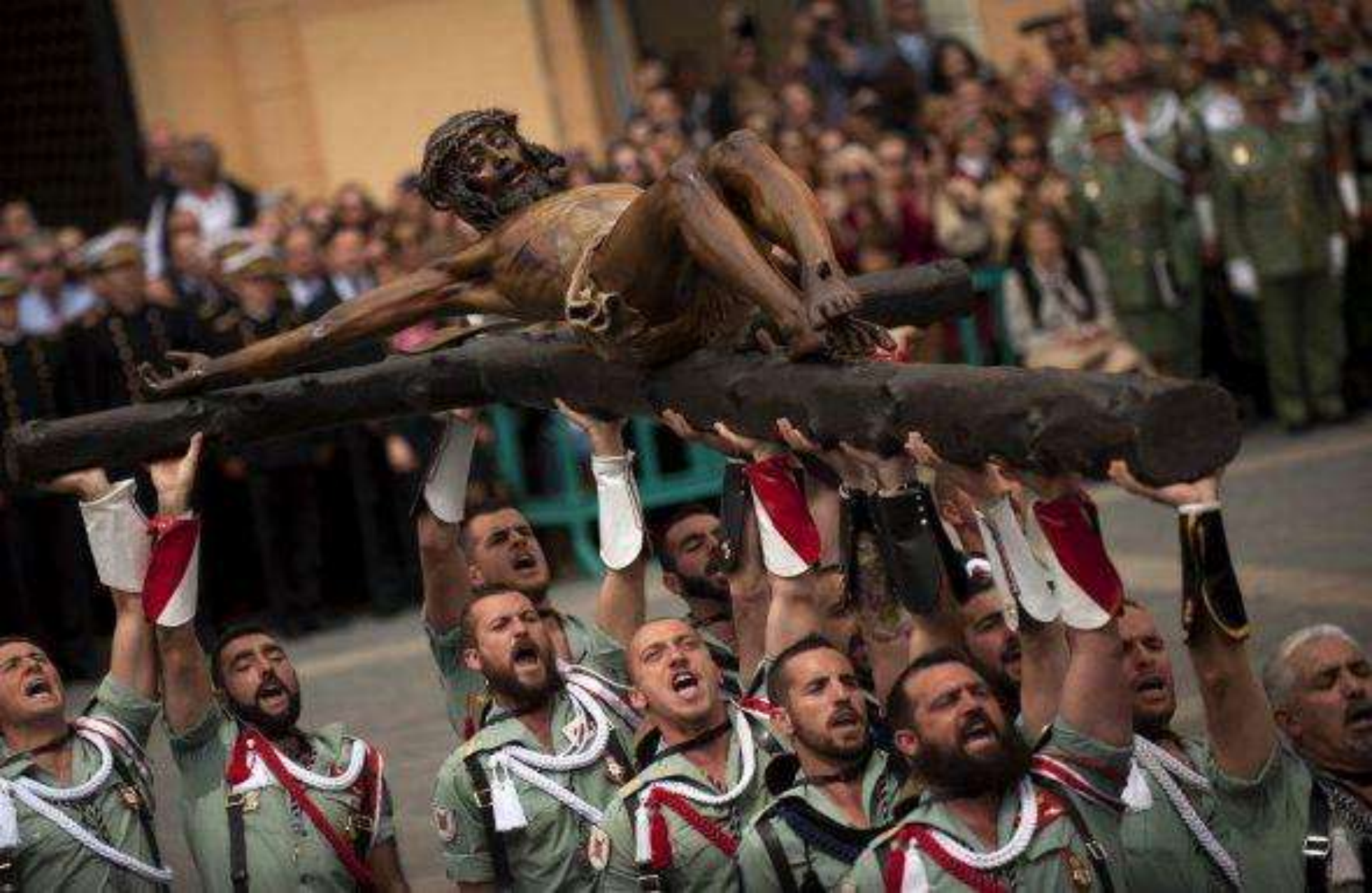
En realidad son los miembros de la Legión Española durante la procesión de Semana Santa en Málaga