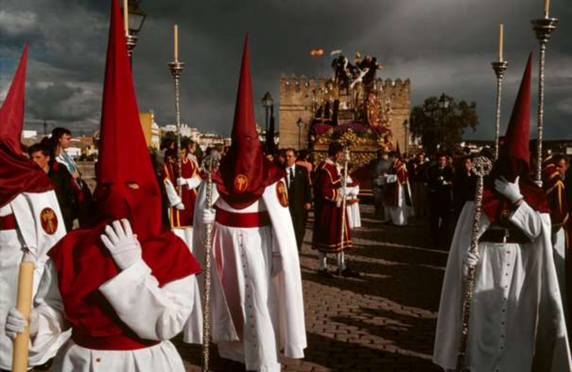
Procesión en Córdoba, España