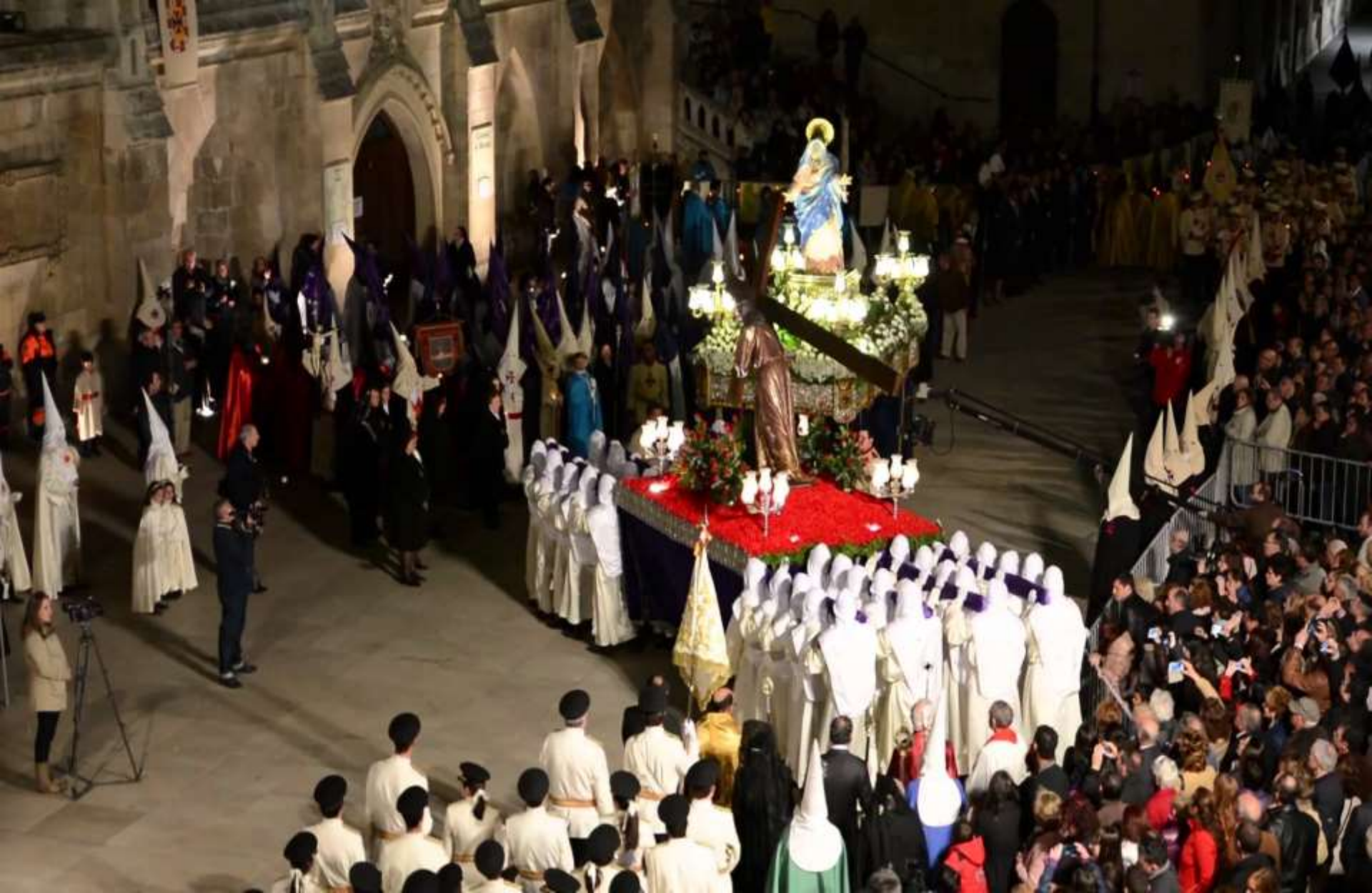
Procesión del Encuentro, Semana Santa Burgos