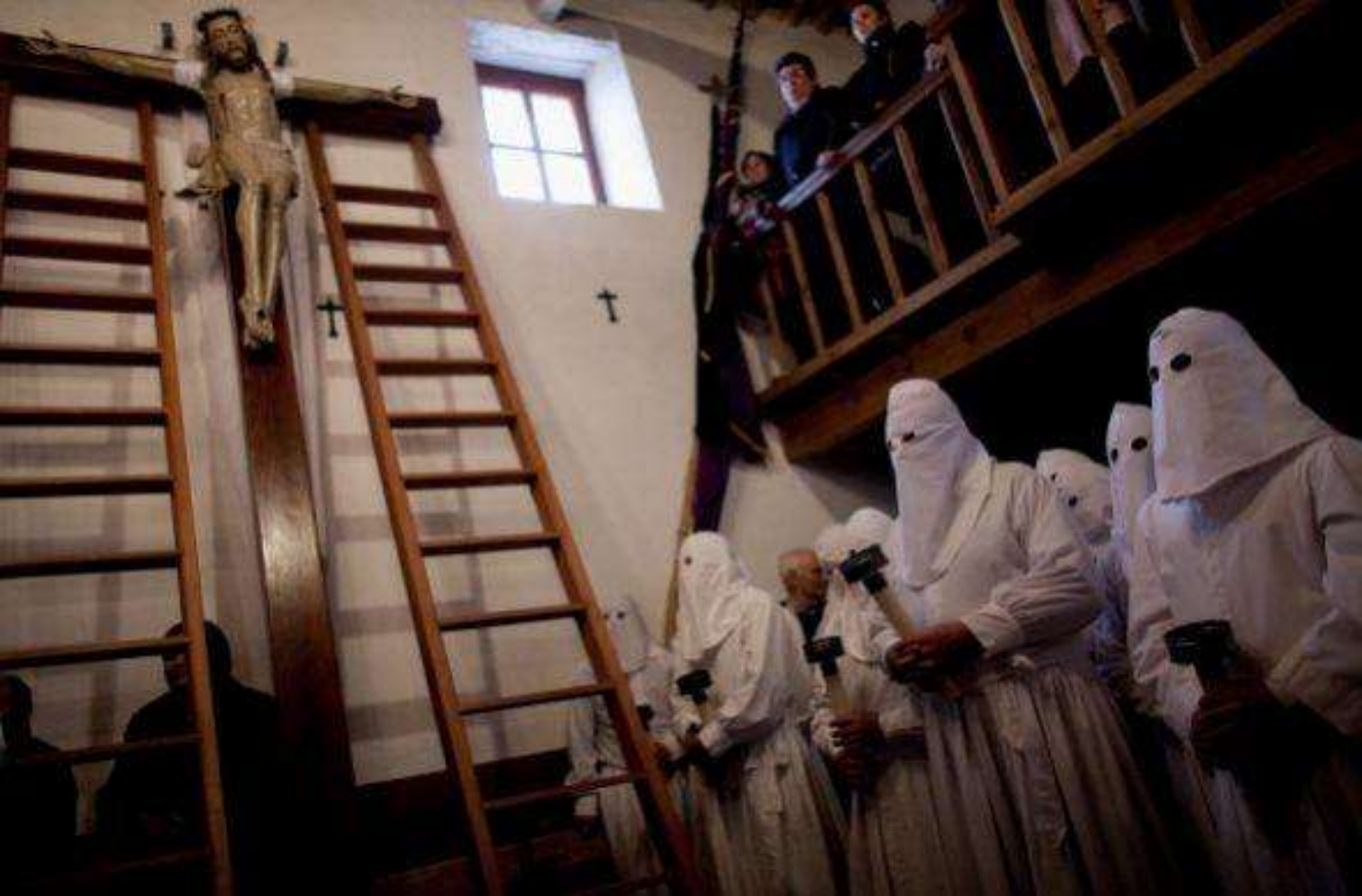
Se trata de los penitentes de Zamora, España