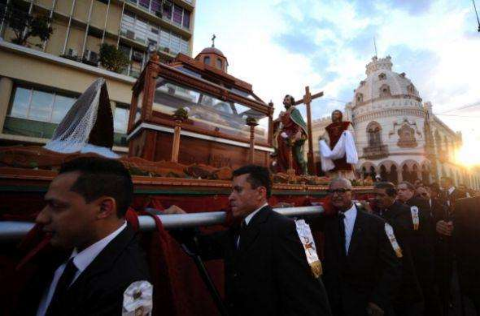
En ésta, la figura de Jesús de Nazaret sale de las Iglesias y desfila por las calles en brazos de los fieles