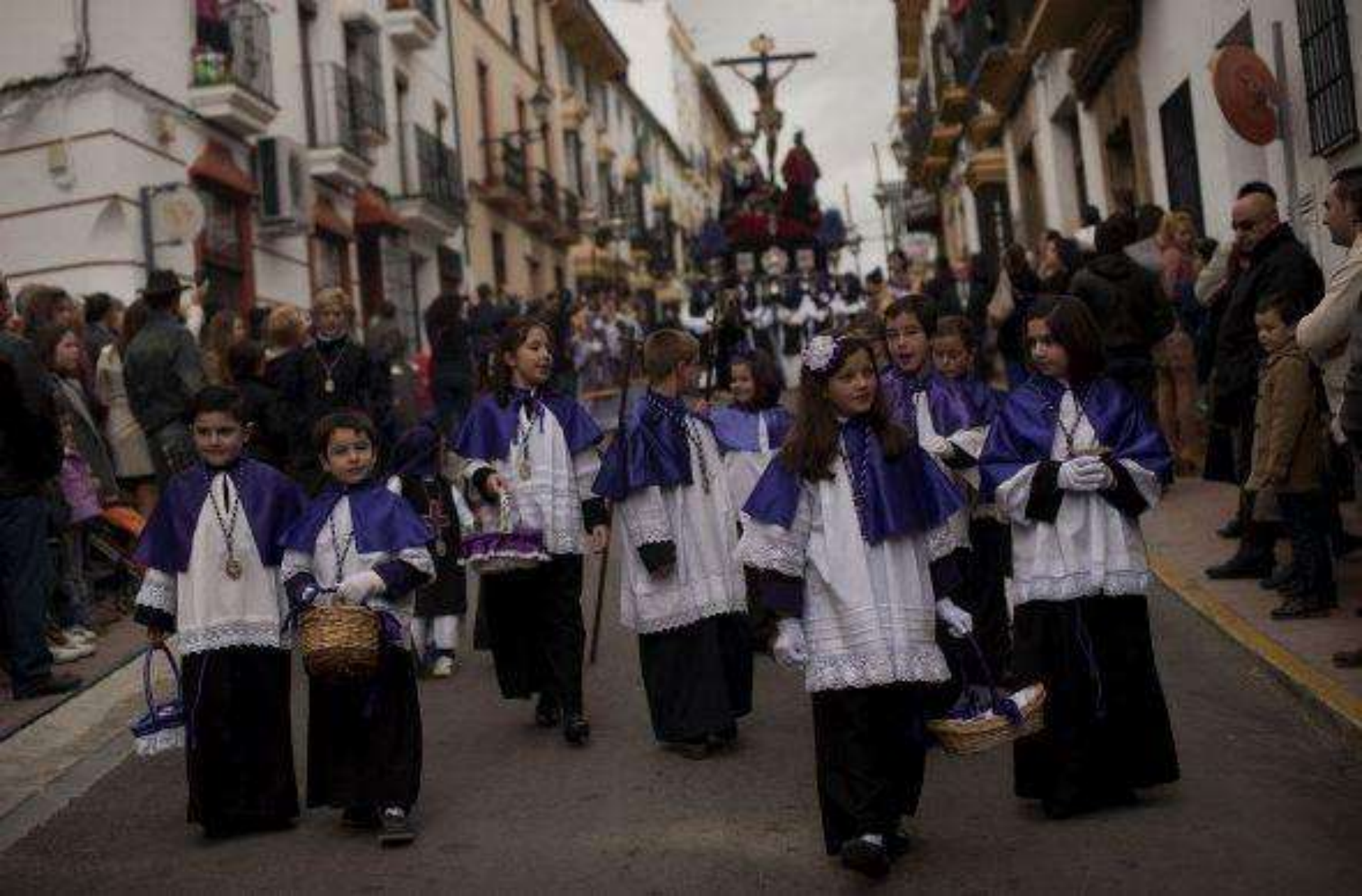
Otros niños participan en las celebraciones de Semana Santa, como estos pequeños españoles