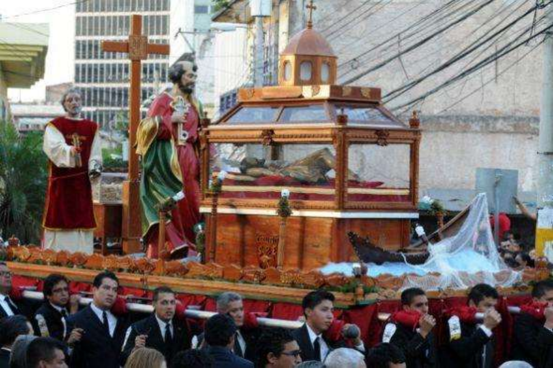
En tanto, los hondureños celebran el Viernes Santo con una procesión