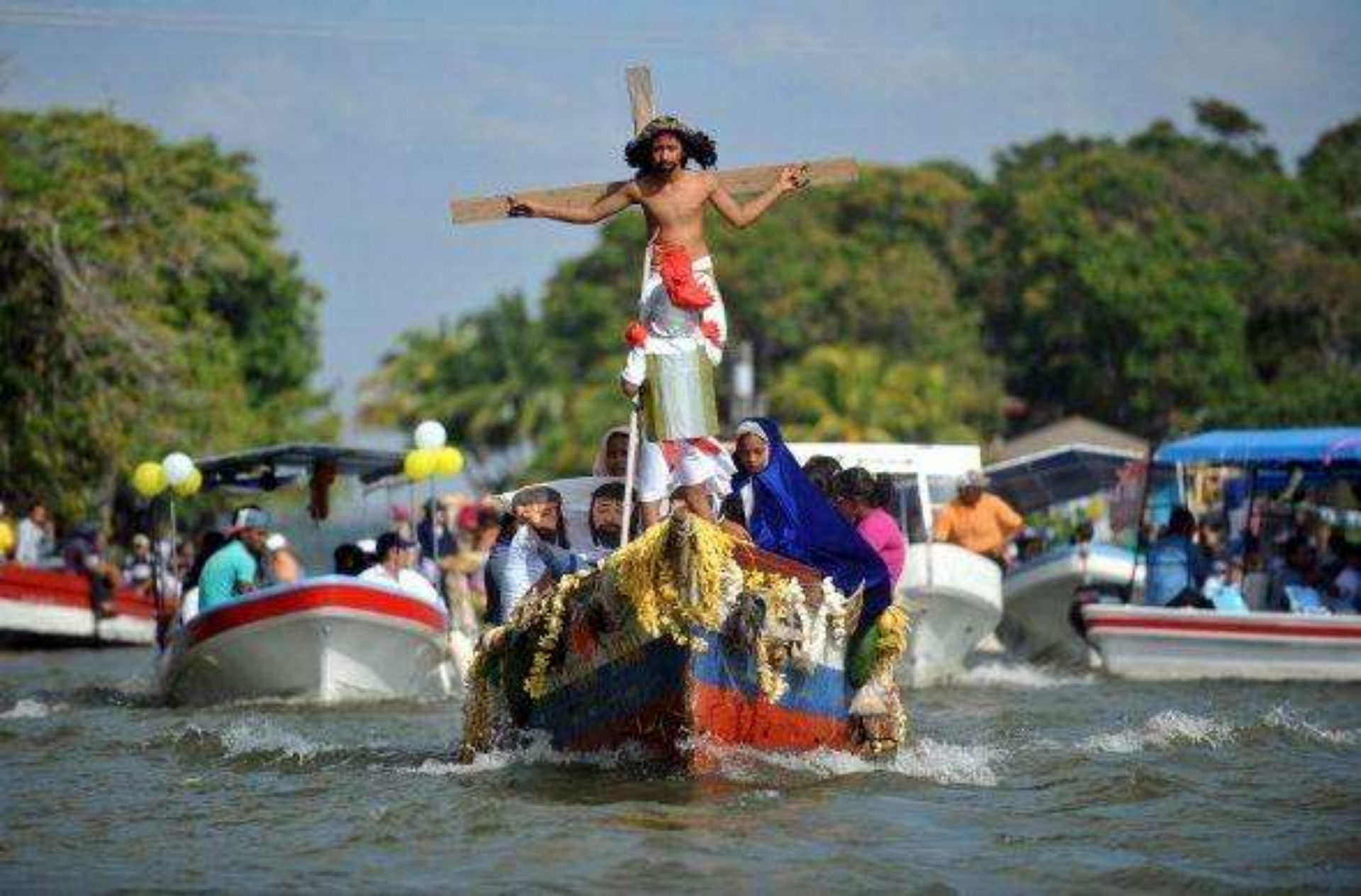
Se celebra entre los islotes del lago Cocibolca en Nicaragua