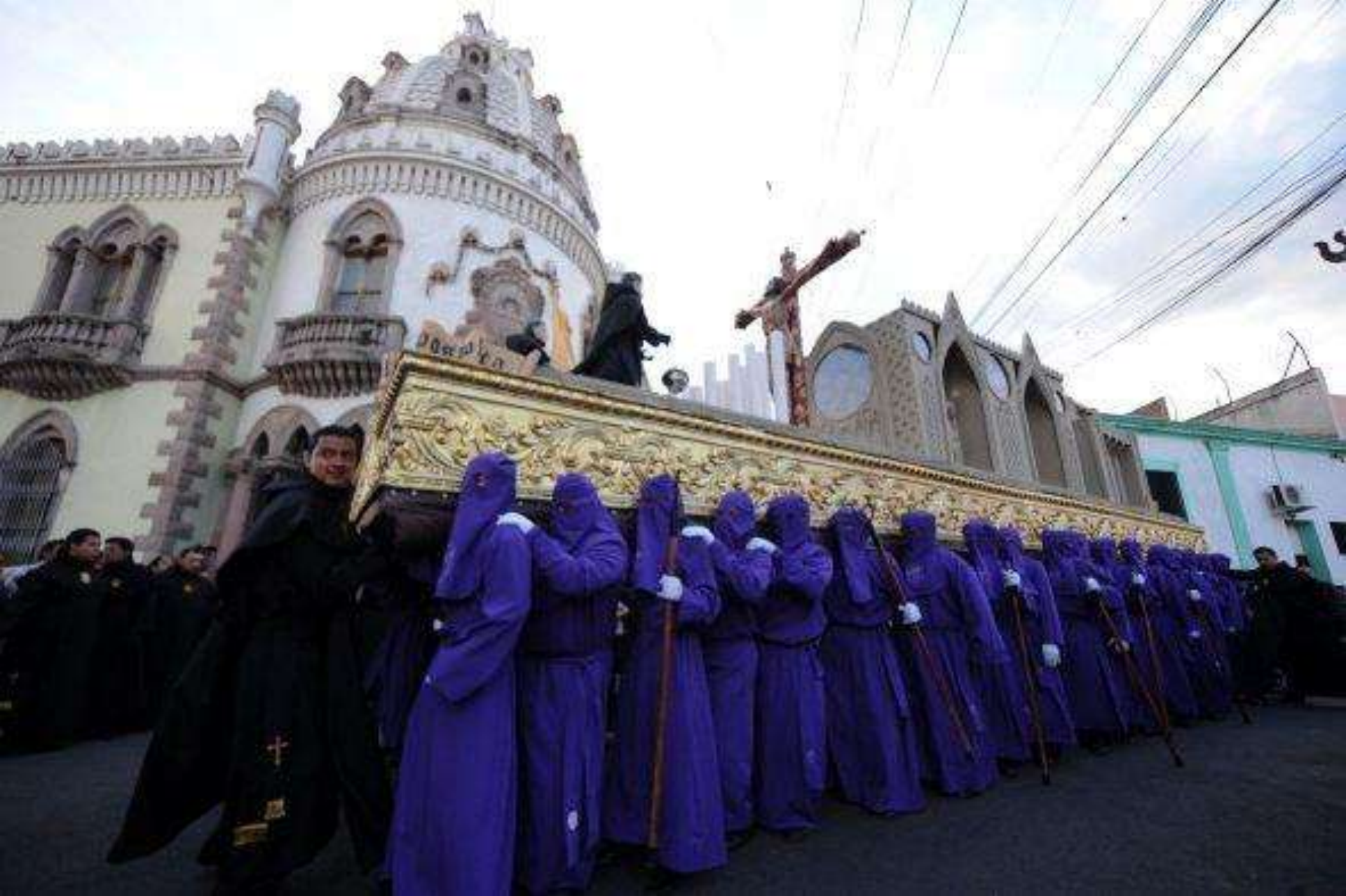
Cientos de personas desfilan por las calles de Tegucigalpa, Honduras