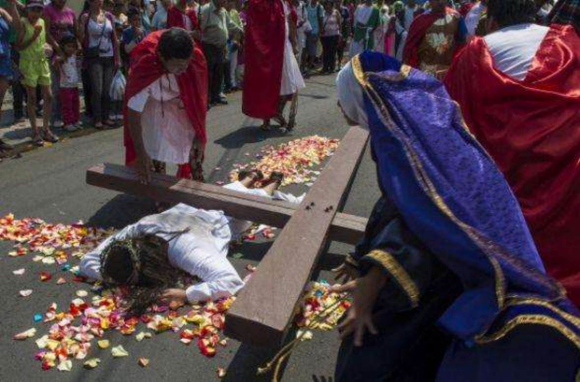
Una de las representaciones más famosas es la de Iztapalapa, una delegación de la Ciudad de México