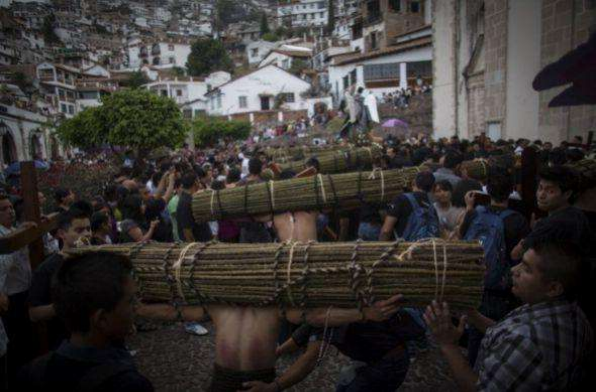
Se trata de hombres que de forma voluntaria caminan por las escarpadas calles con las manos atadas y el rostro cubierto