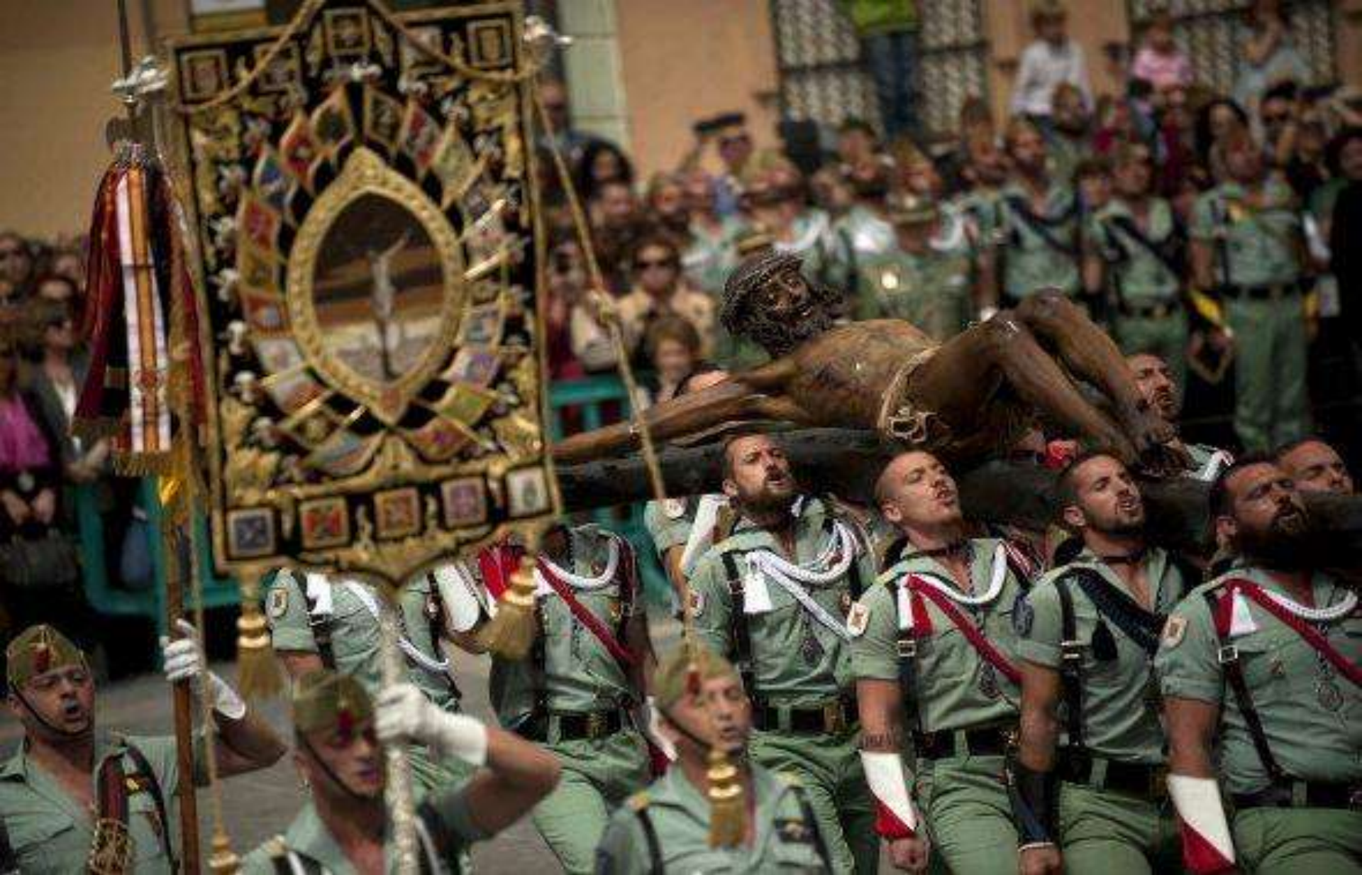
Los miembros de la Legión Española cargan una estatua del Cristo de la Buena muerte de la iglesia de Santo Domingo de Guzmán