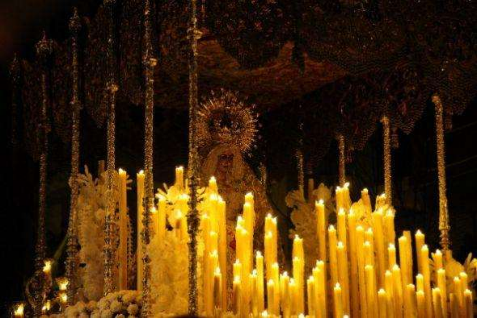
En Sevilla, España, la Virgen de Macarena se llena de velas en Semana Santa