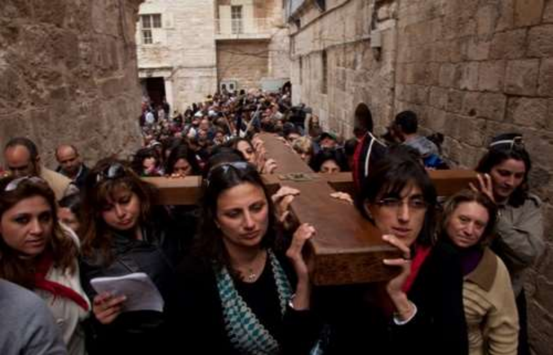
Procesión del Viernes Santo por la Vía Dolorosa, Jerusalén