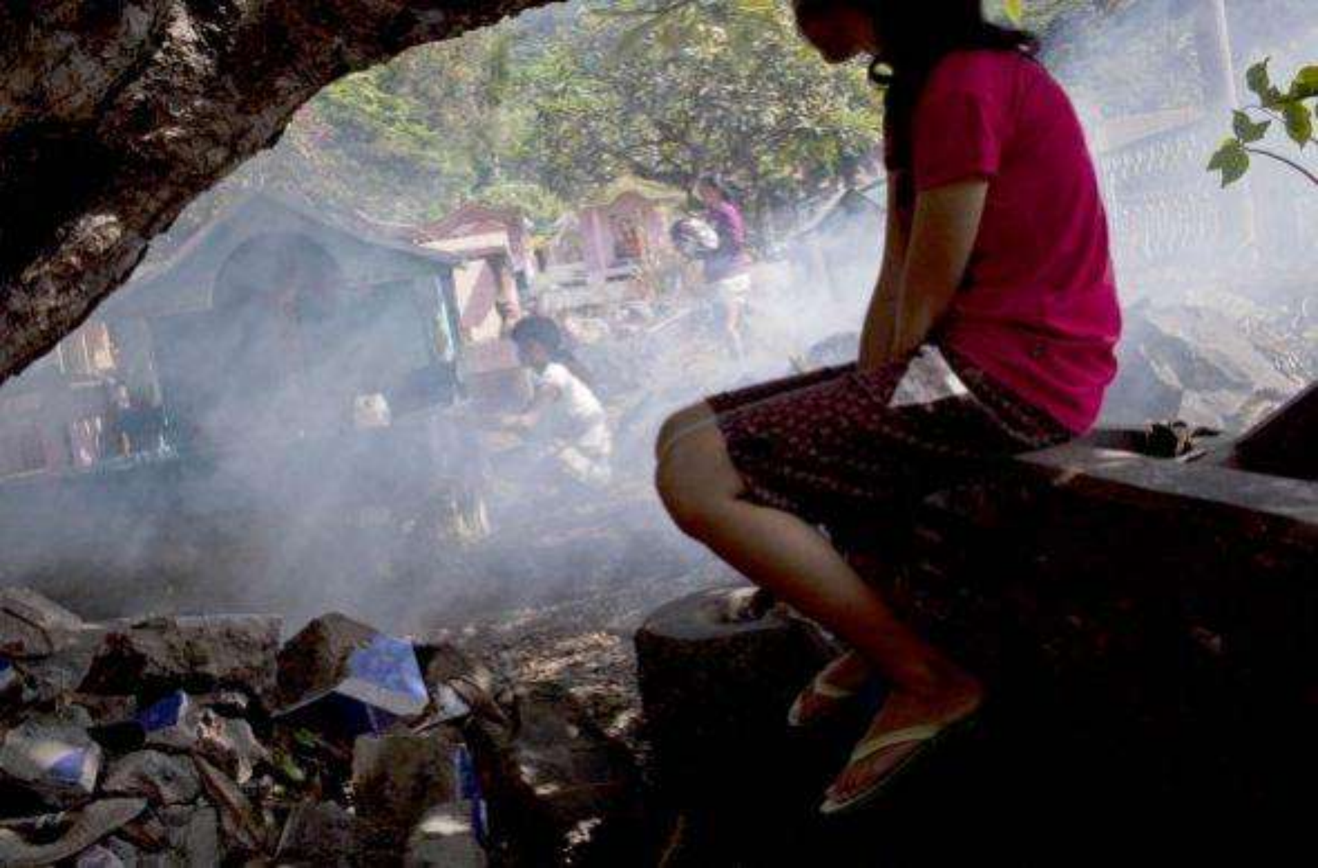
Los indonesios celebran limpiando las tumbas de sus antepasados durante Semana Santa