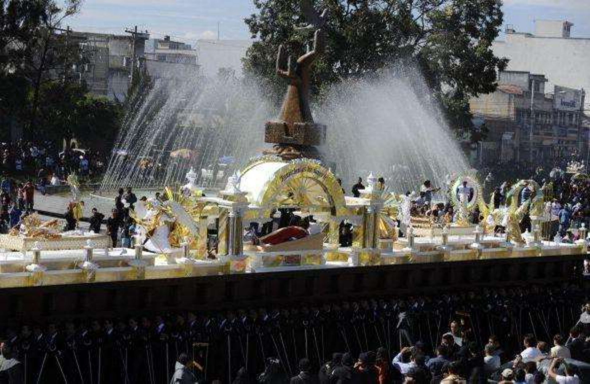
En Guatemala los católicos generan multitudes durante las celebraciones del "Santo Entierro"