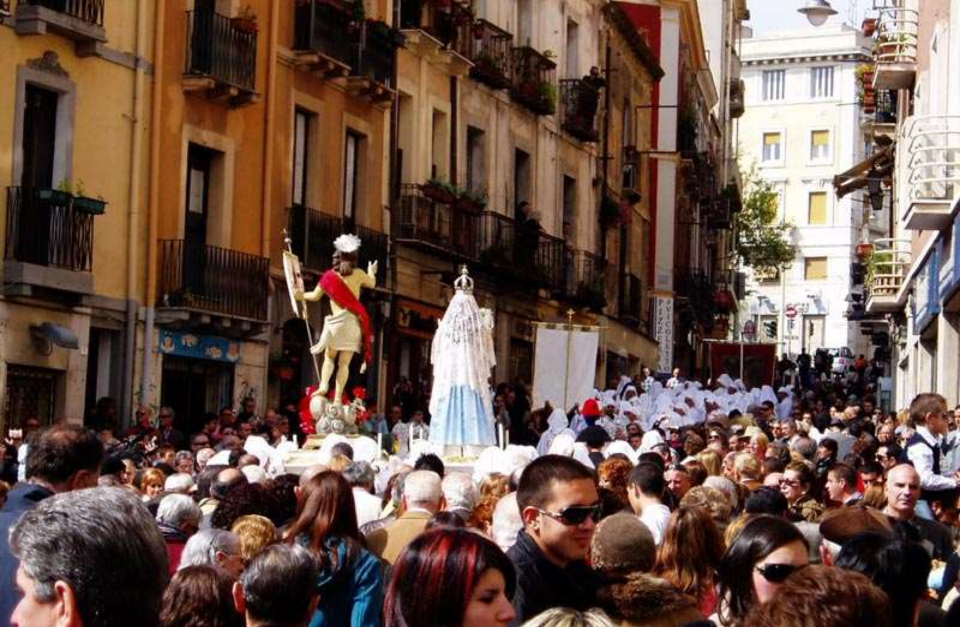
Procesión de Semana Santa en Cagliari, Cerdeña