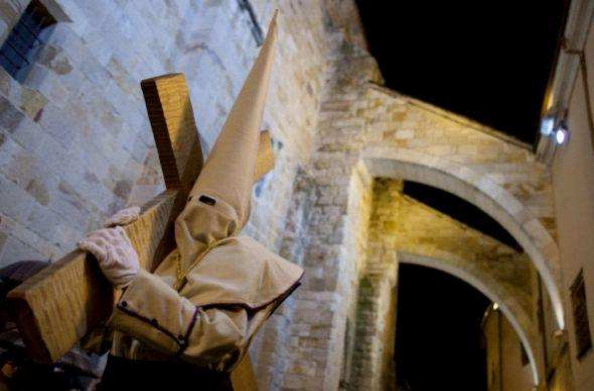
En Zamora, España, un penitente encapuchado carga una pesada cruz durante la procesión de Semana Santa