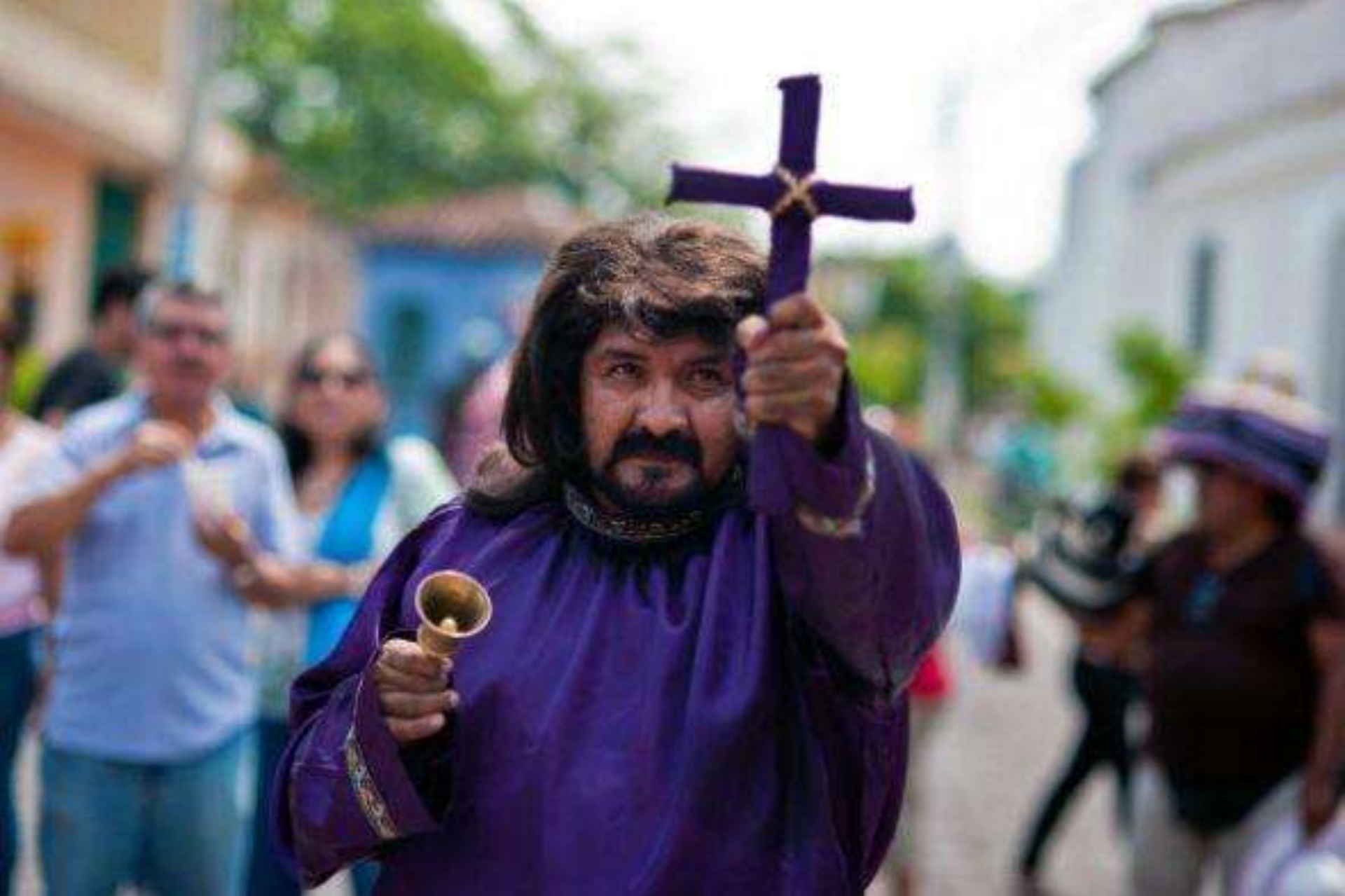
Además de los diablos enmascarados, en las celebraciones también participan personas disfrazadas de sacerdotes en Texistepeque, El Salvador