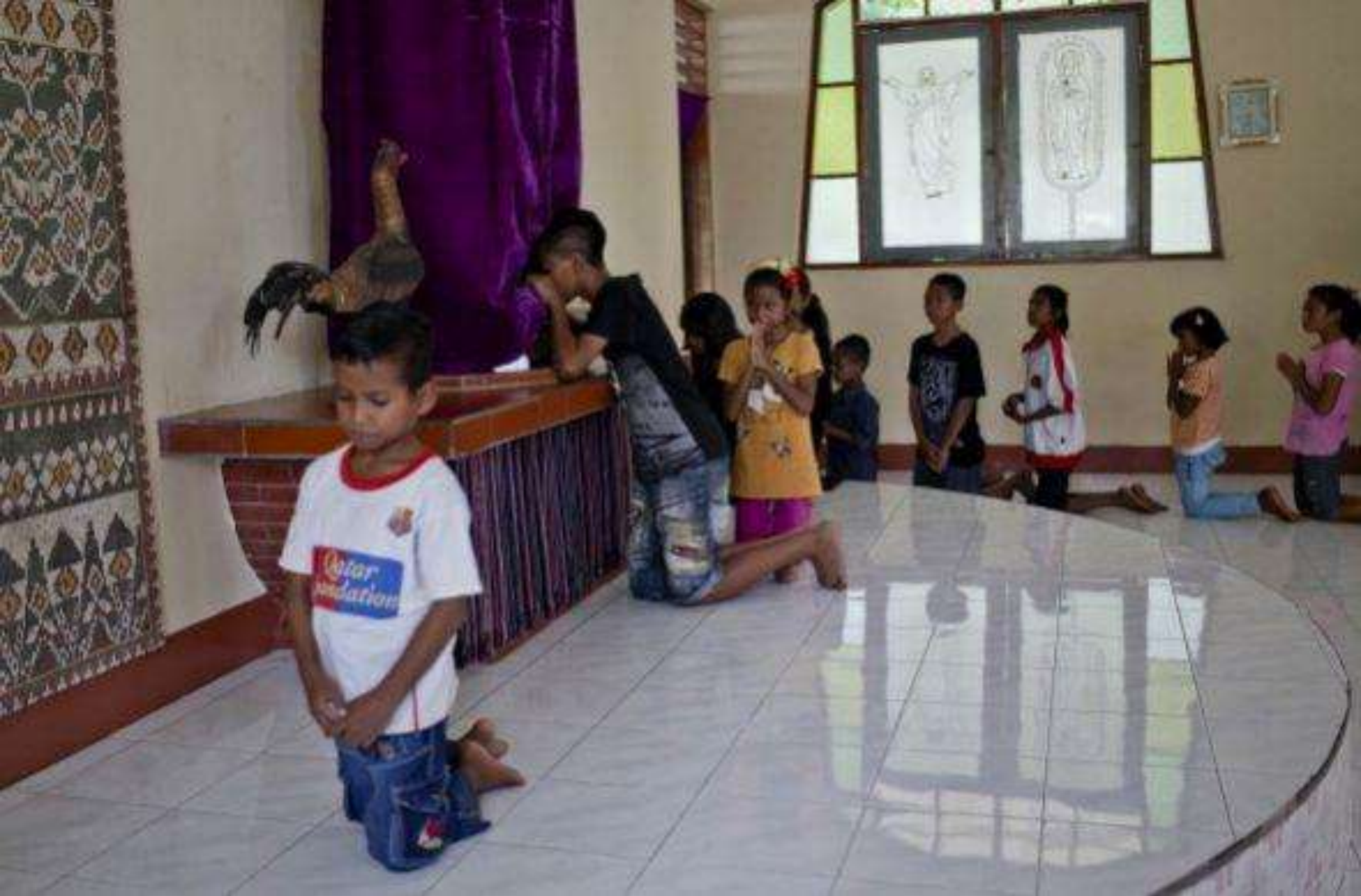
Durante estas fechas los cristianos asisten a la iglesia a besar lo pies de la imagen o escultura de Jesucristo