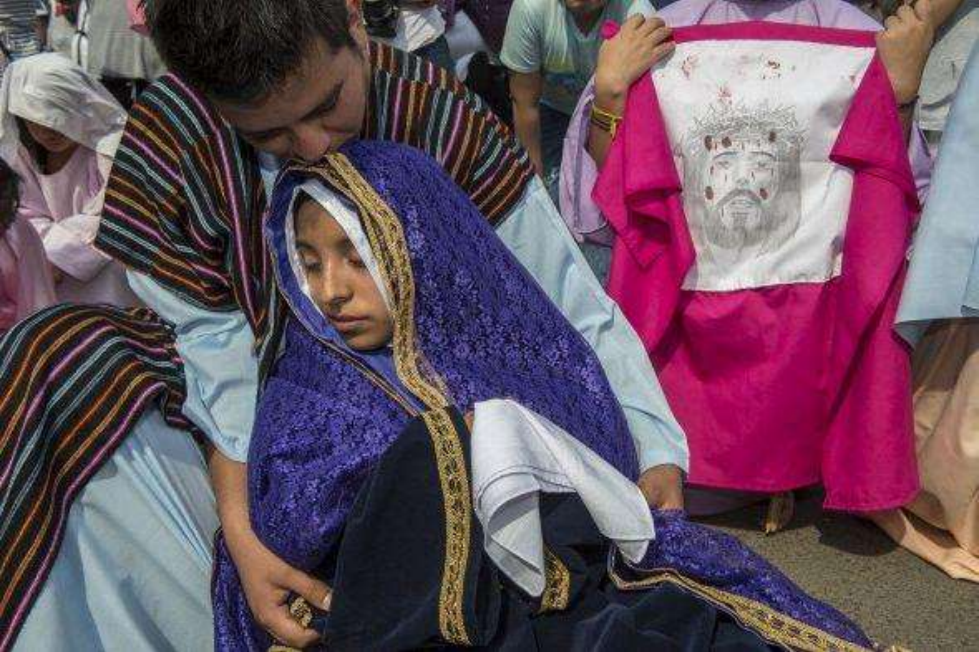
Participan cientos de actores y es seguida por miles de personas