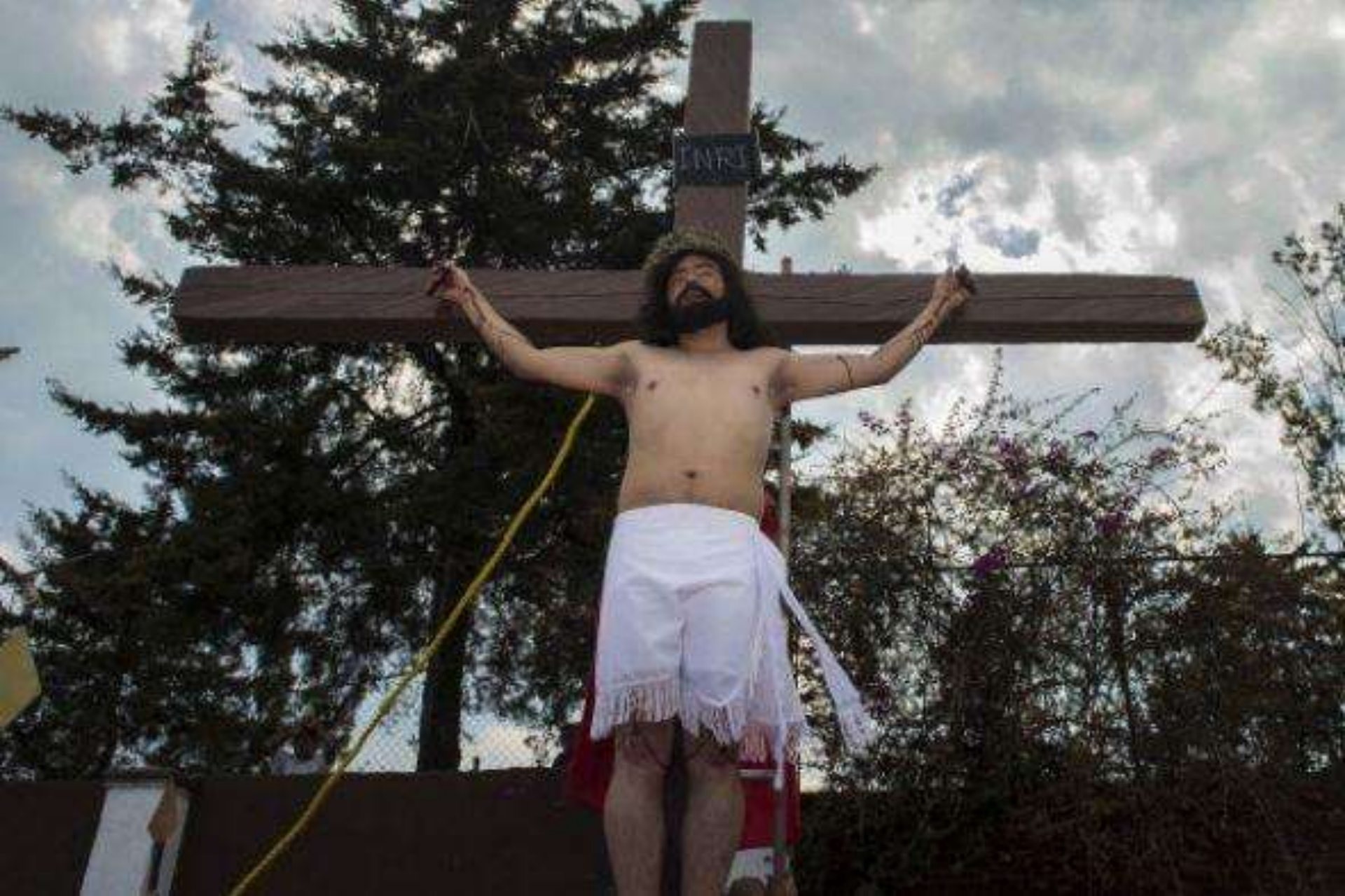
La Pasión de Iztapalapa termina con la Crucifixión