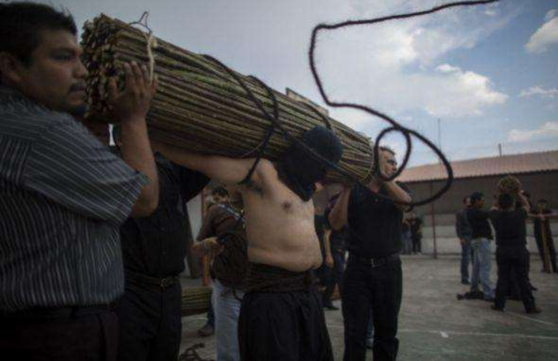
En Taxco, un pueblo de Guerrero, México, la Semana Santa se acompaña de los “penitentes”.