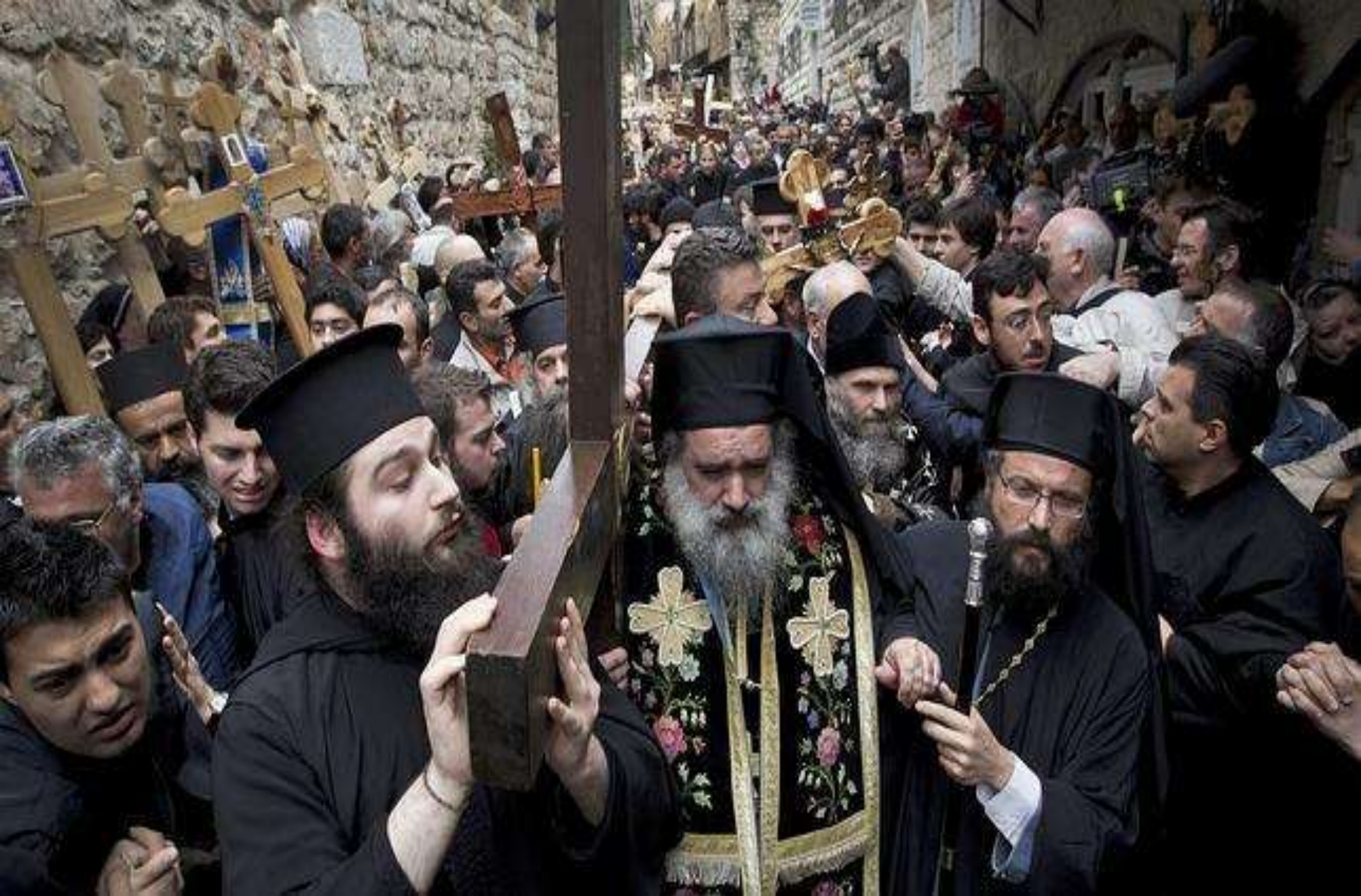
Fieles cristianos durante el recorrido del Vía Crucis por la Vía Dolorosa, Jerusalén