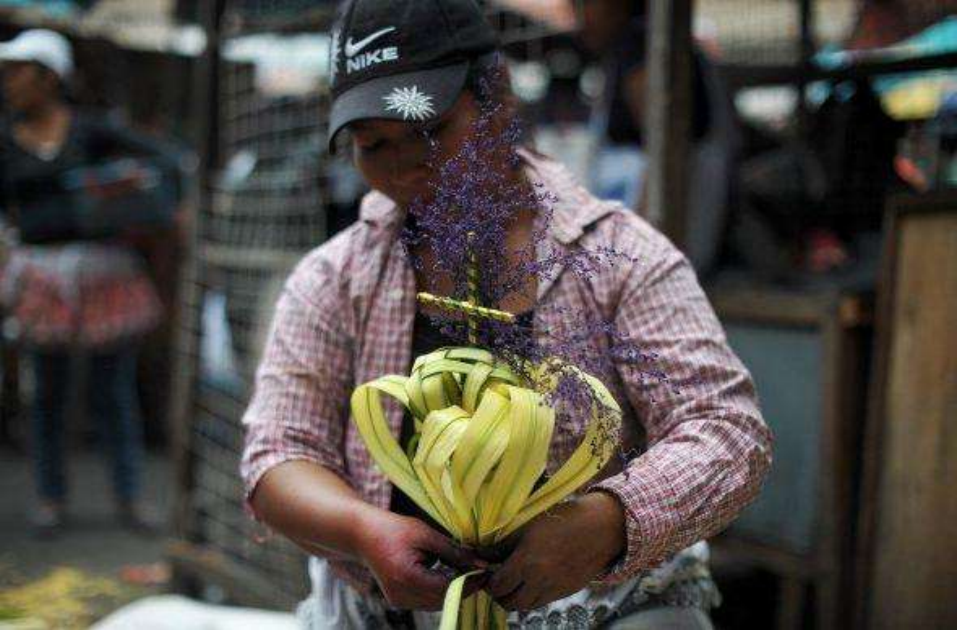
Las celebraciones de Semana Santa arrancan el Domingo de Ramos.