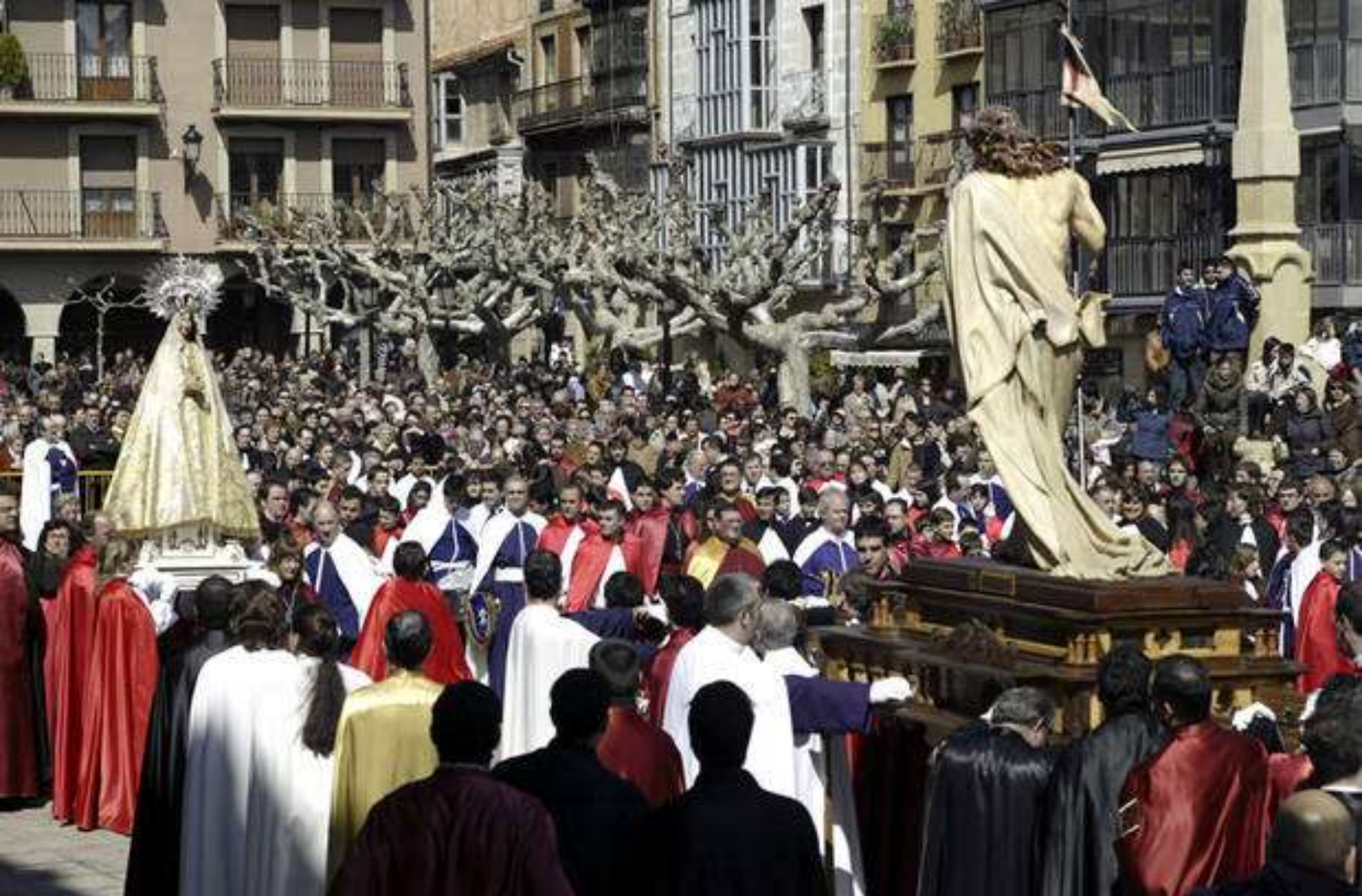
Procesión del Encuentro con el Cristo Resucitado y la Virgen de la Alegría en la plaza Mayor de Soria