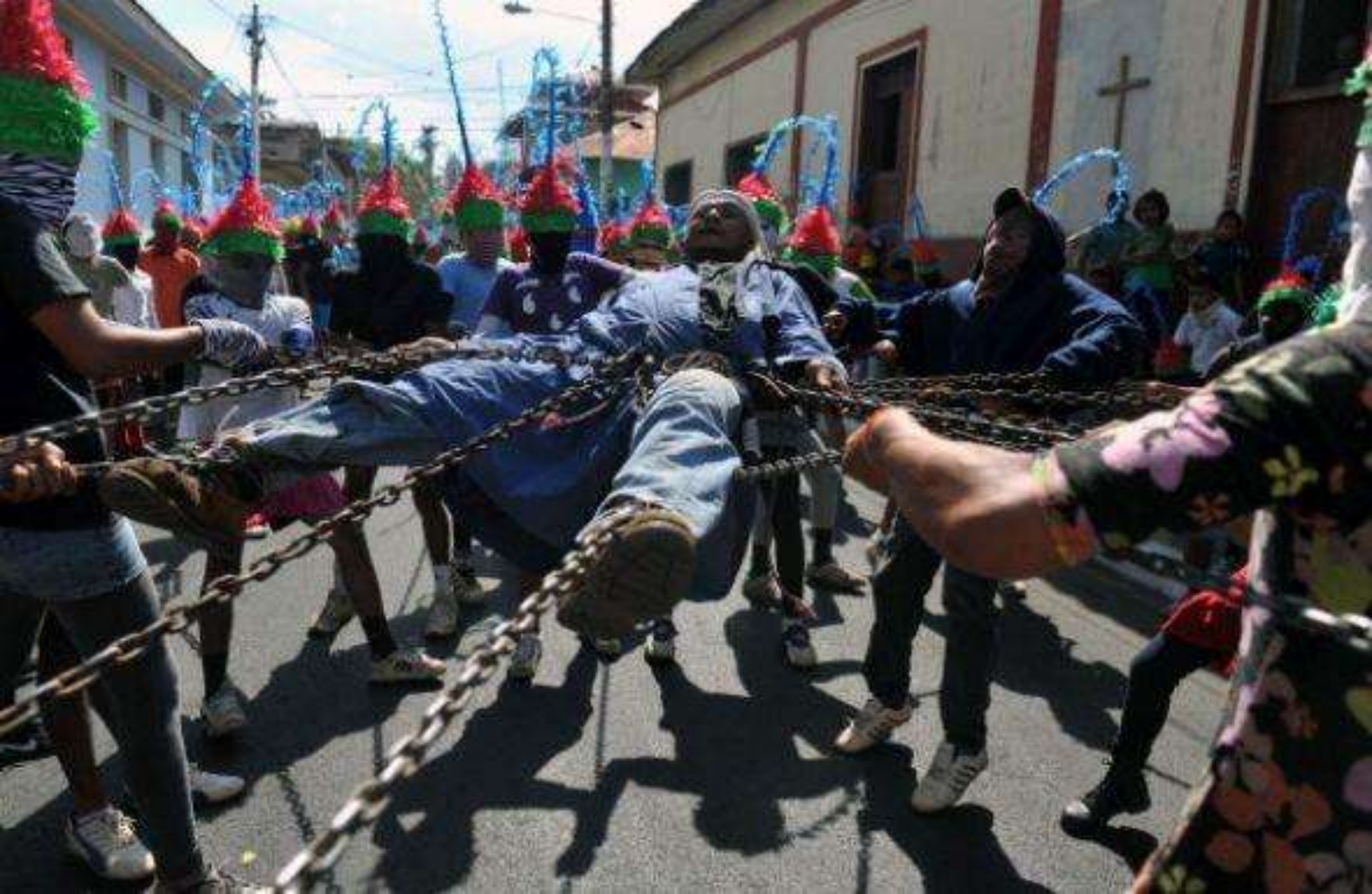
Durante la cual se persigue y captura a personas vestidas de Judas y se arrastran encadenados por las calles por traicionar a Jesucristo