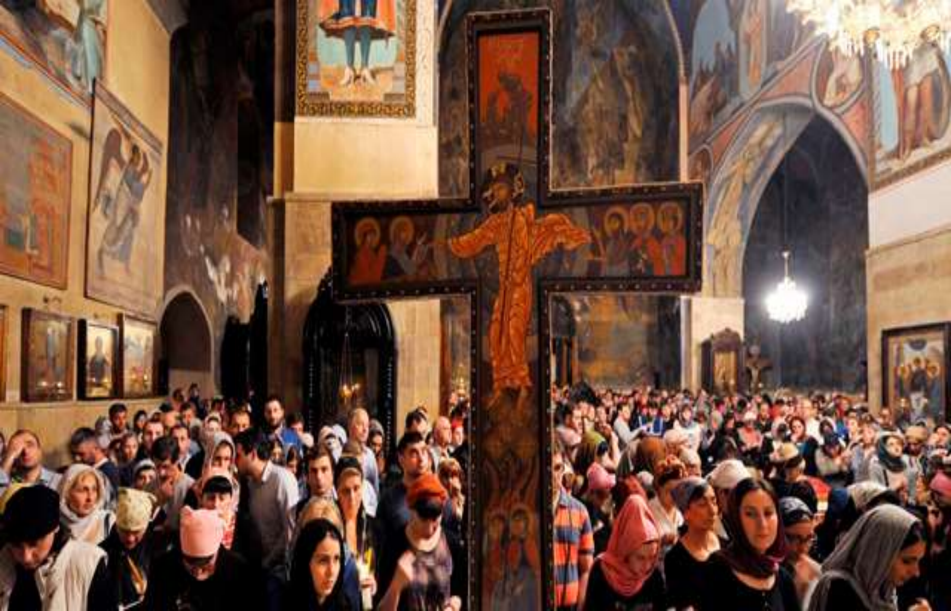
Creyentes participan de la ceremonia ortodoxa en la Catedral de Sioni, en Tbilisi (Georgia)