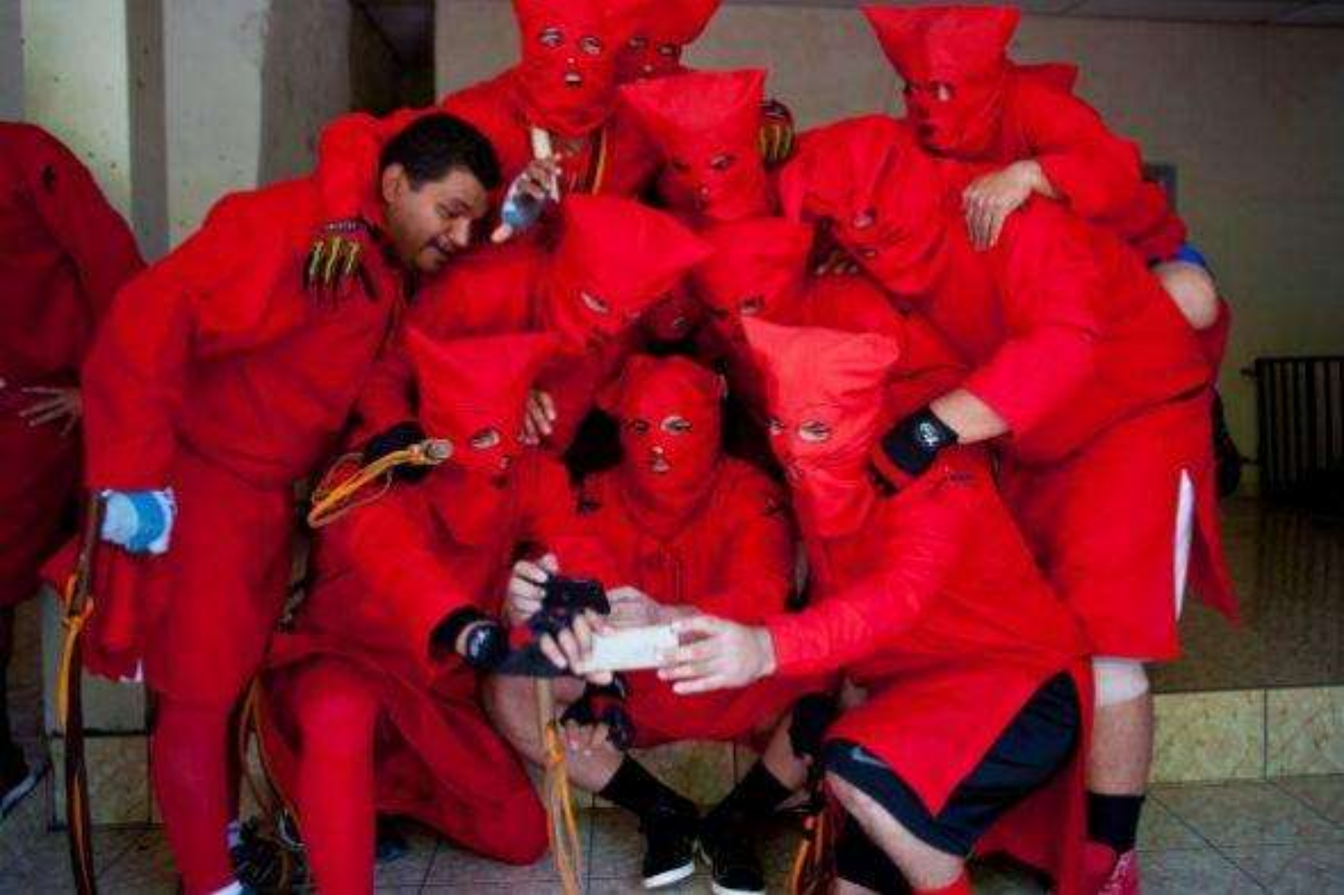
Se trata de los “Talgucines”, son parte de una antigua tradición de Semana Santa en Textistepeque, El Salvador