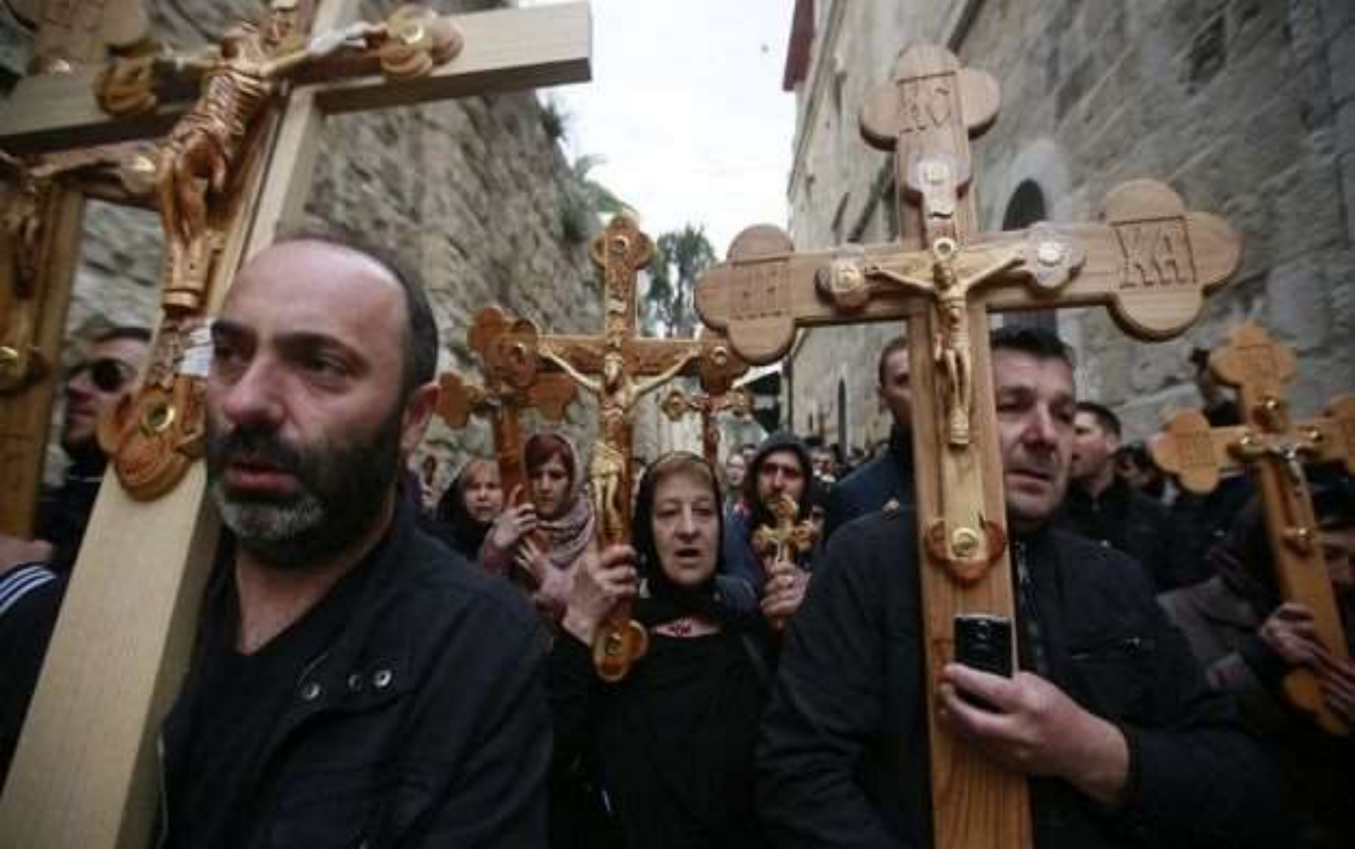
Peregrinos del todo el mundo durante la procesión de Viernes Santo ortodoxo en la ciudad vieja de Jerusalén