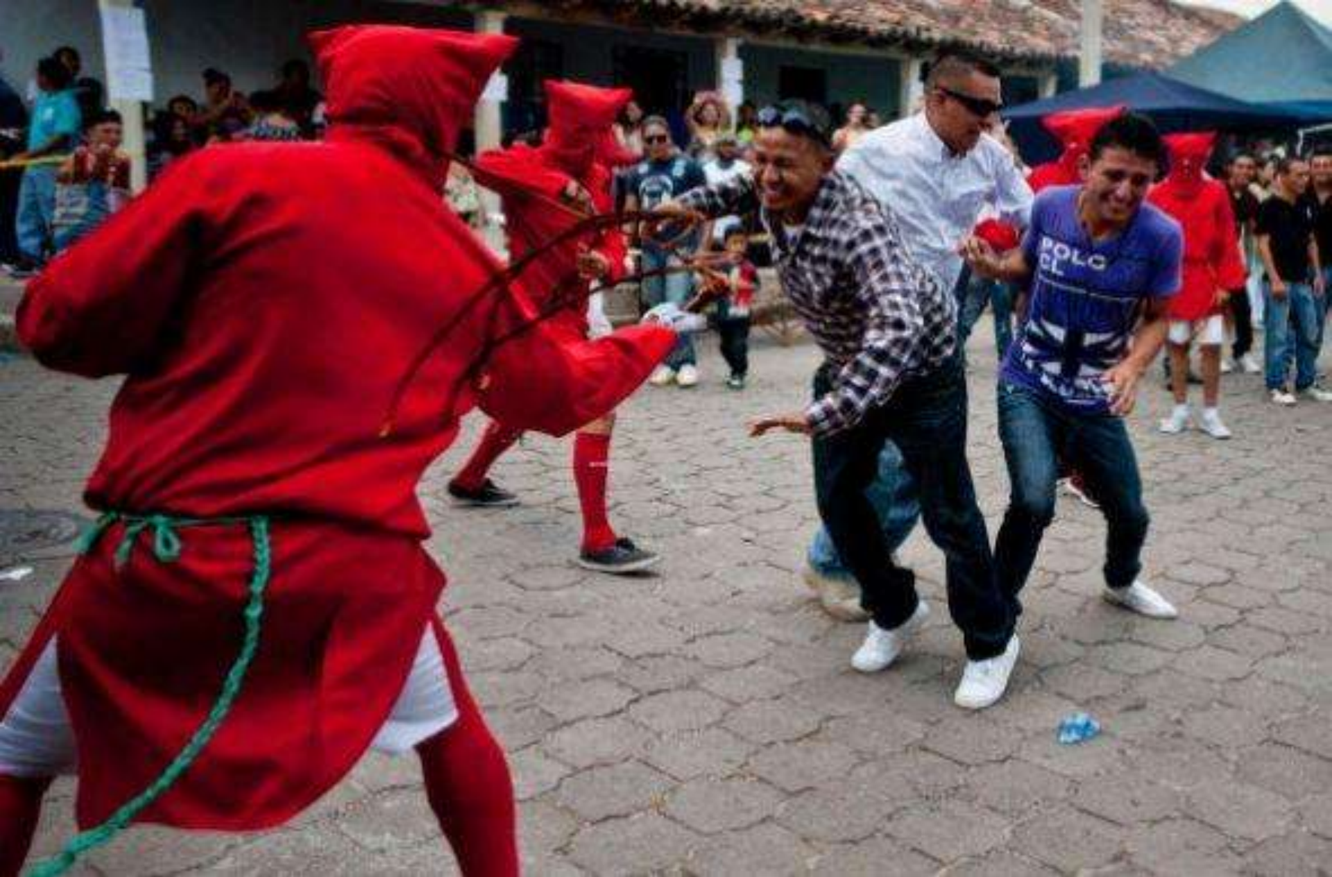
Durante los festejos, los “Talgucines” arremeten contra los fieles católicos para limpiar sus pecados