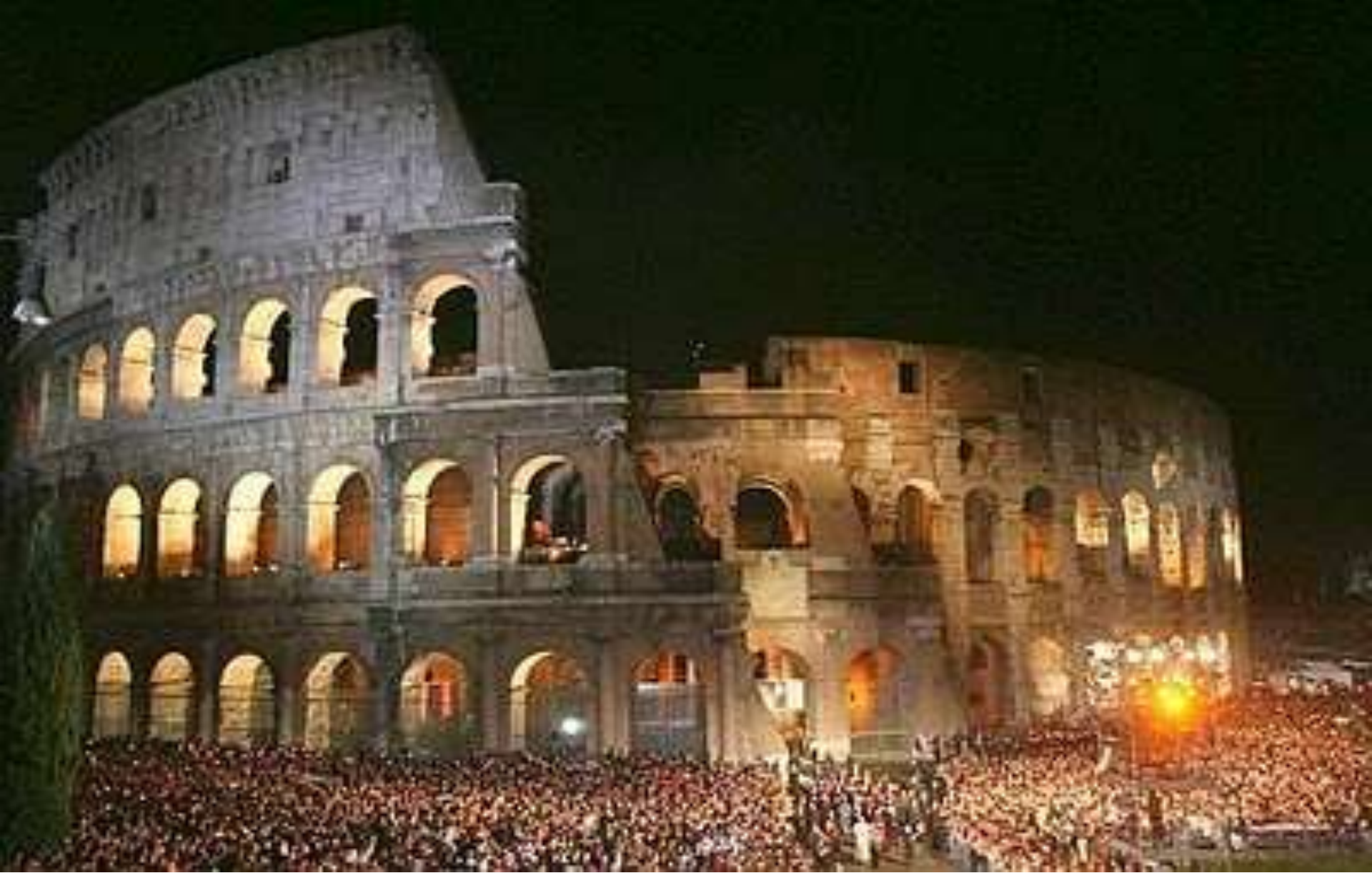
Via Crucis en Roma