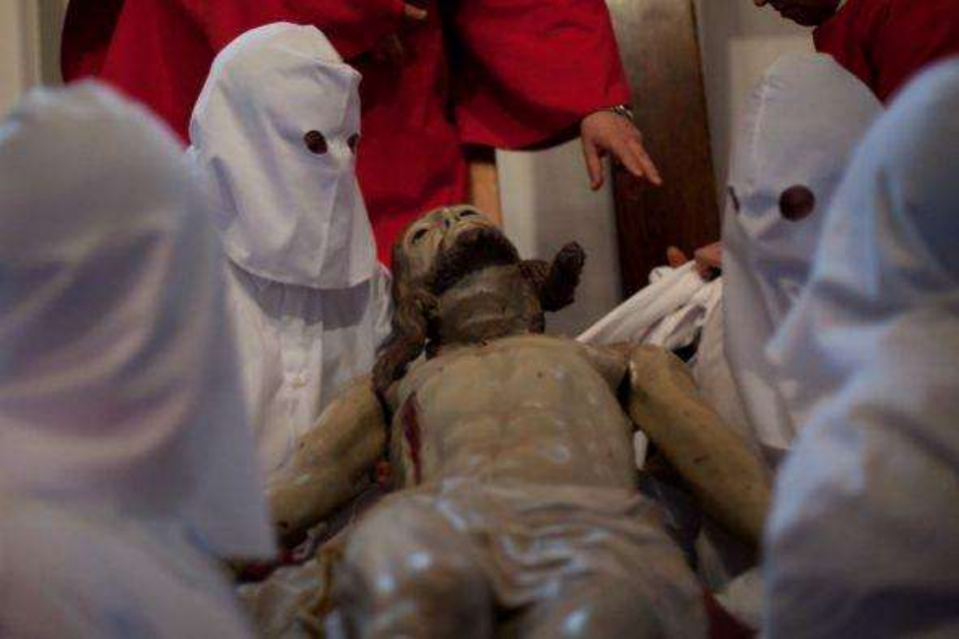
Los penitentes de Zamora bajan de la cruz la imagen de Jesucristo antes del inicio de su procesión