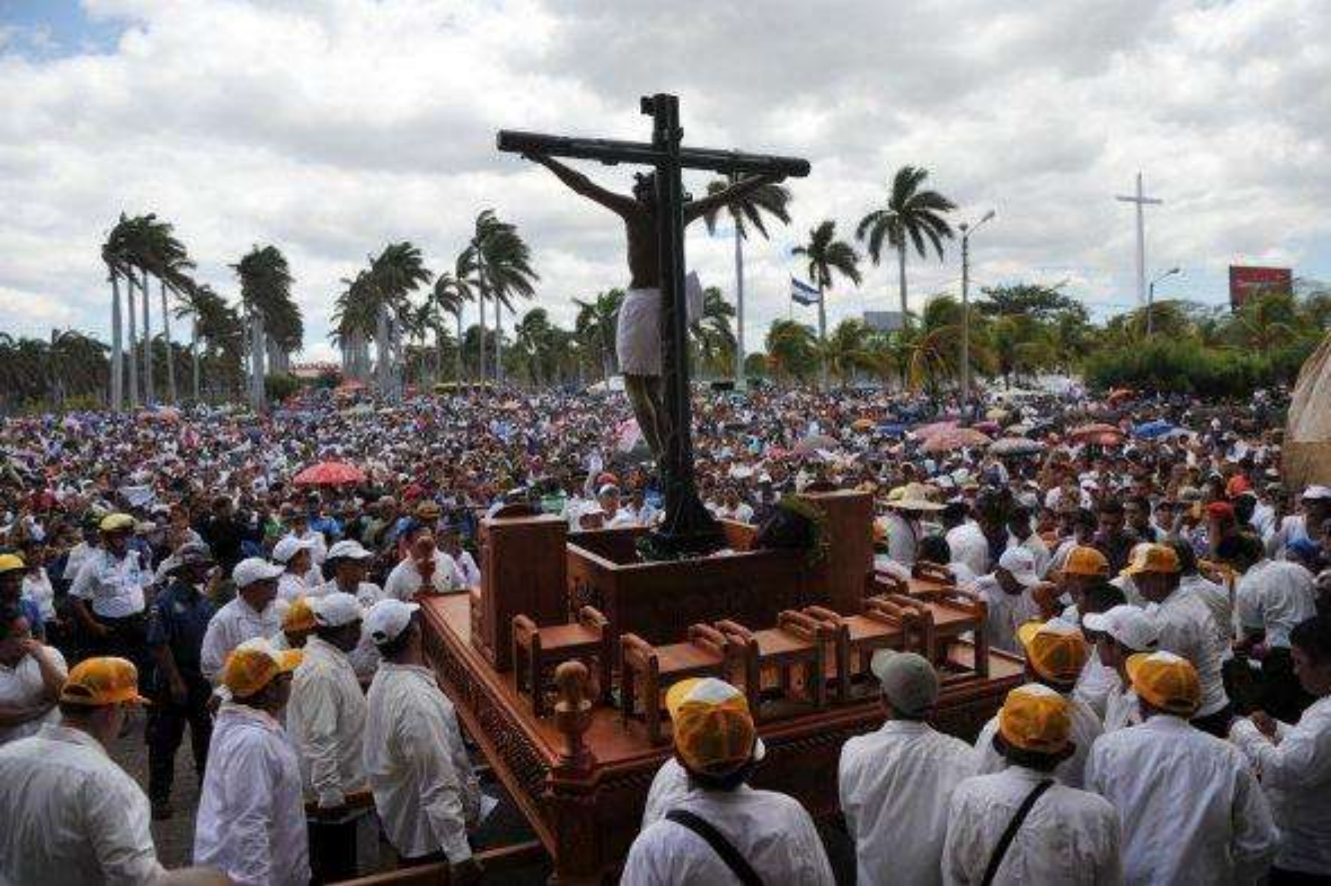
En Nicaragua, cientos de fieles se reúnen en la Catedral de Managua para celebrar el Viernes Santo