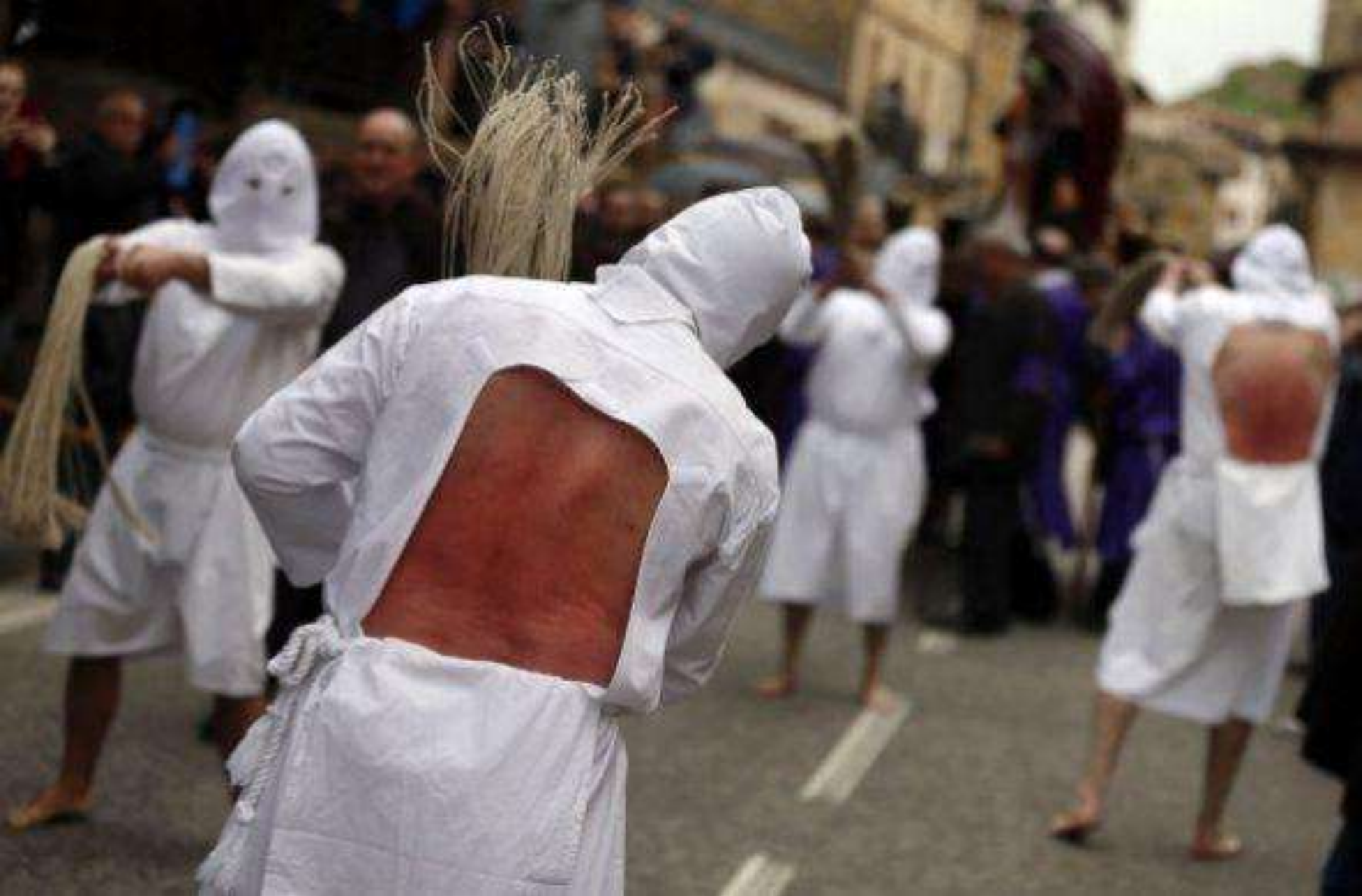
Se trata de los penitentes de Picao durante la procesión “Santa Vera Cruz” en San Vicente Sonsierra, al norte de España