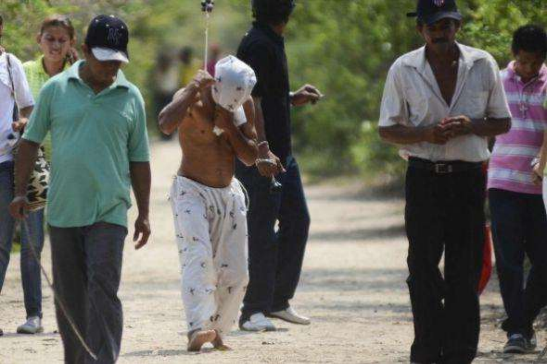
Más tarde, los penitentes desfilan golpeando sus espaldas