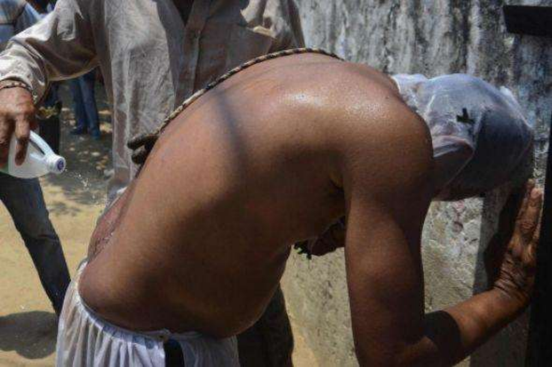
Un hombre vierte alcohol en el coxis de un devoto en Santo Tomás, departamento Atlántico, Colombia