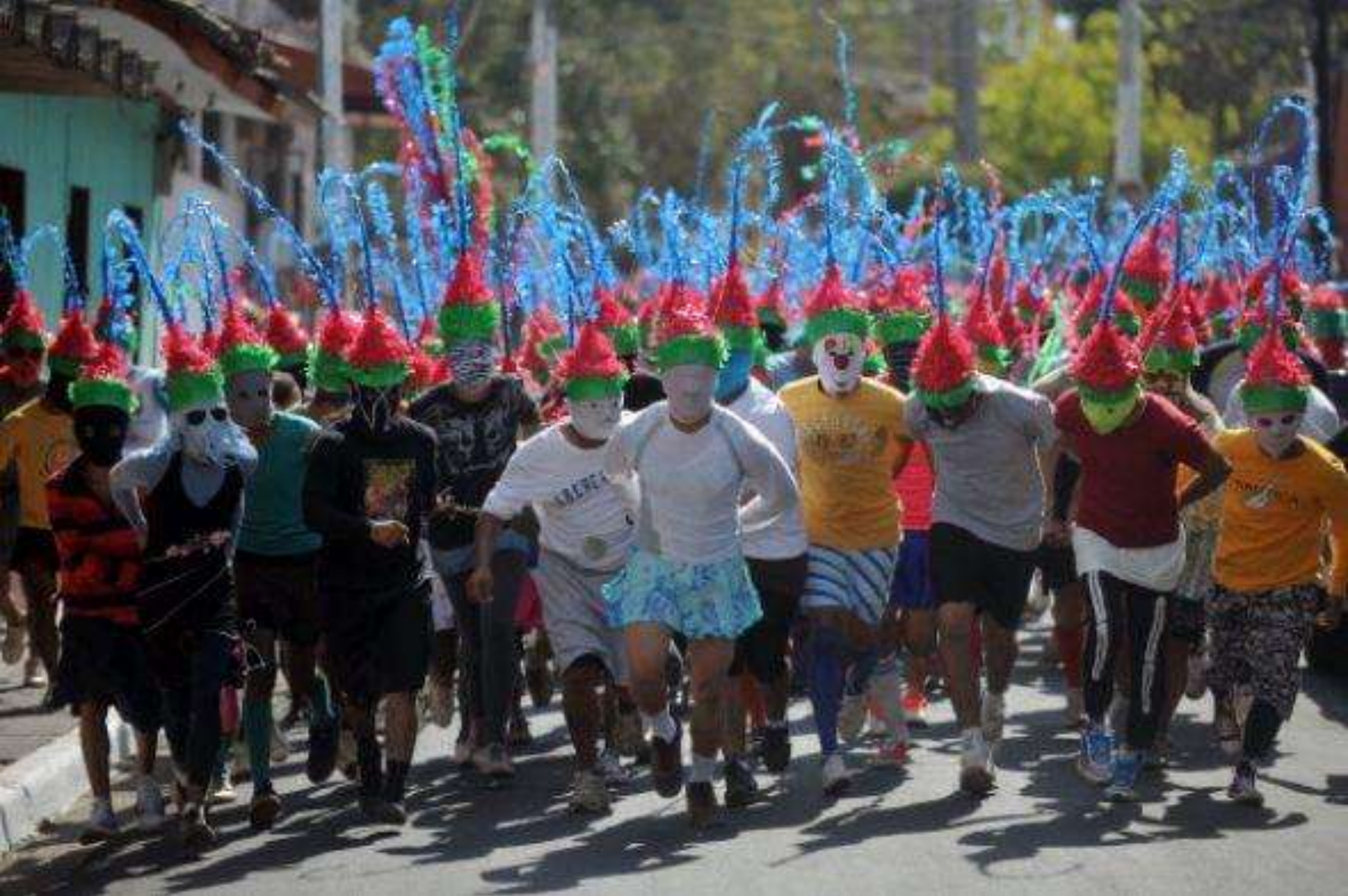
Los lugareños se colocan sombreros rojos y verdes y toman parte en la procesión llama “Los encadenados”