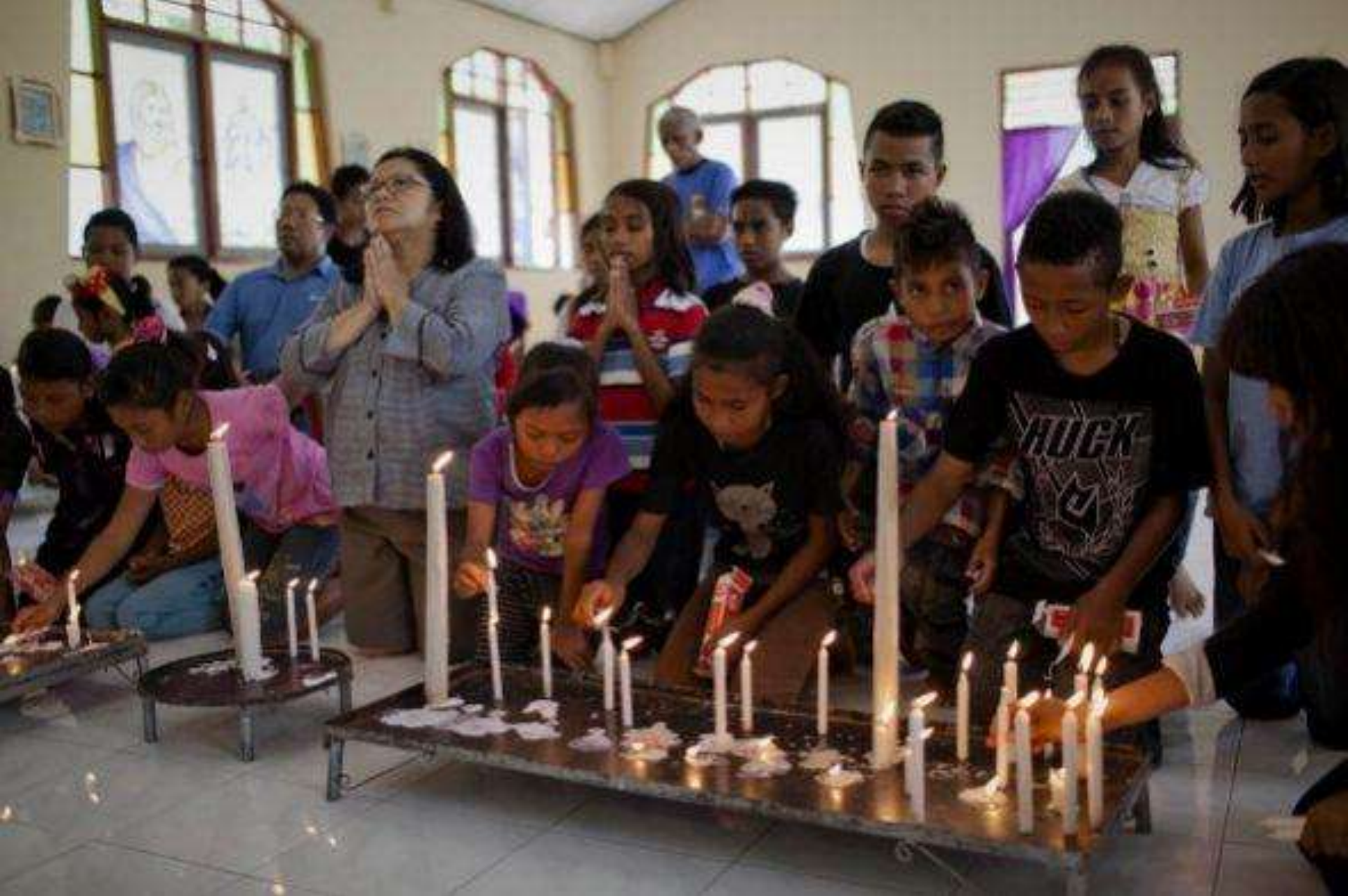
En Indonesia los cristianos son minoría (la mayoría de la población es musulmana) por lo que suelen celebrar de forma sencilla la Semana Santa